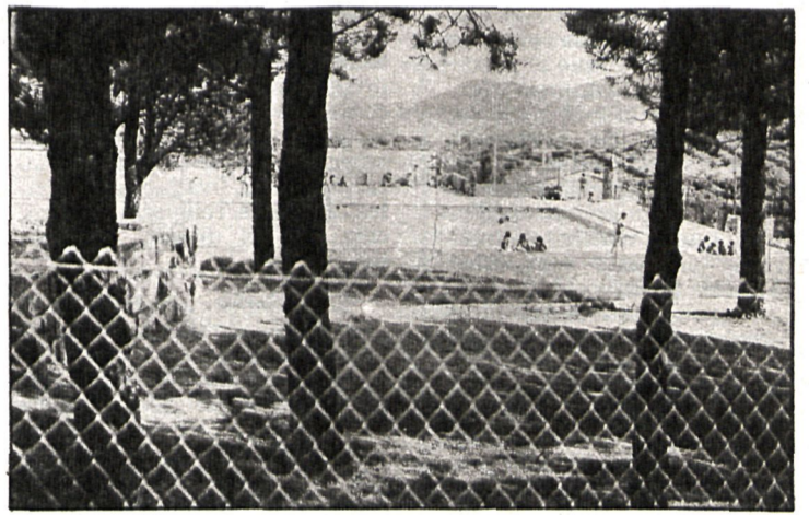
Desde el día de su inauguración, los cadalsoños han tomado al asalto el disfrute de las nuevas instalaciones deportivas

Cenicientos, Navas del Rey, Rozas de Puerto Real y San Martín de Valdeiglesias también cuentan con nuevos parques