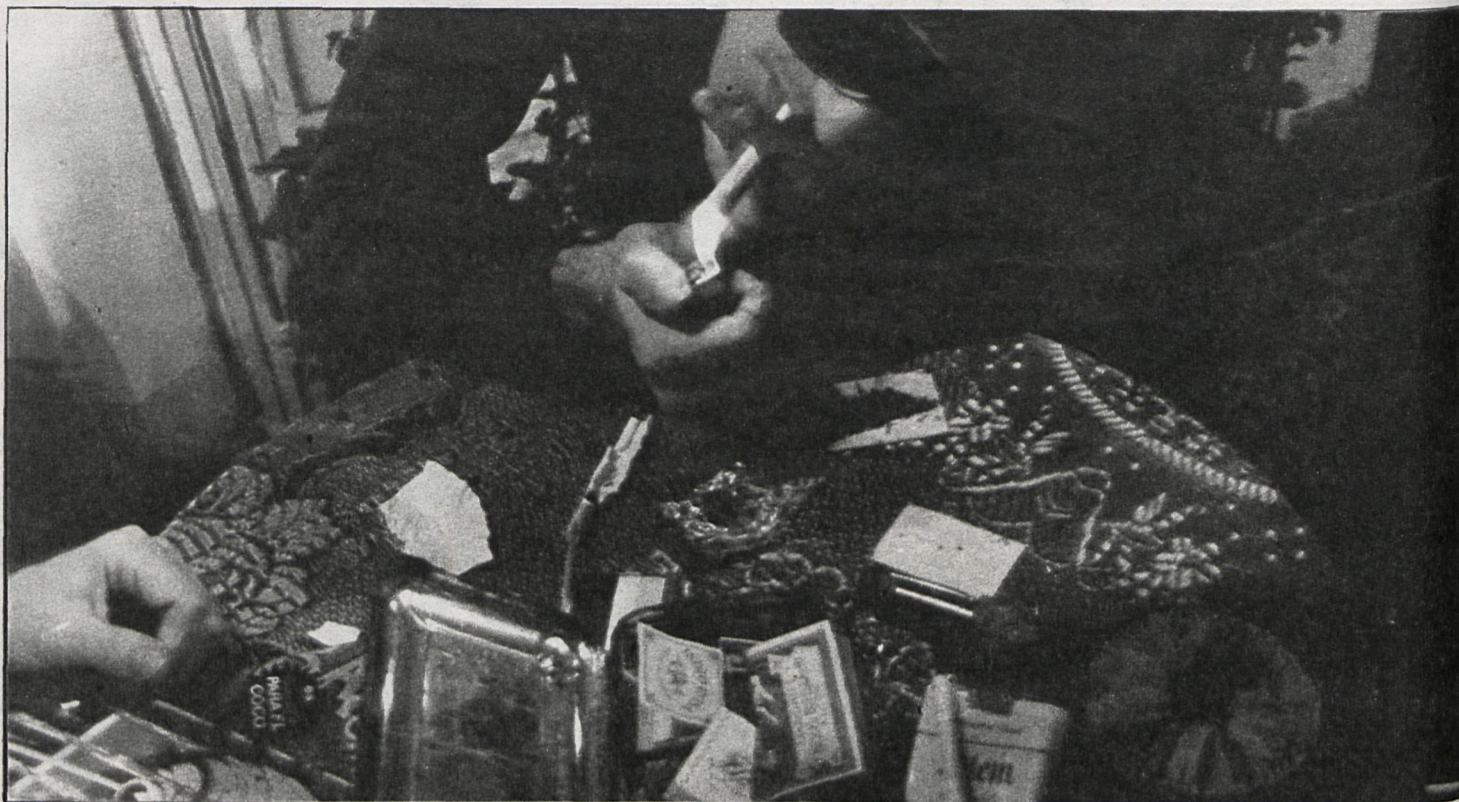
Los jóvenes de Alcalá tienen muy claro que la droga es un problema grave y que el alcohol, una droga legal, es uno de los primeros

Por la incidencia del paro en dicha localidad se planteó la necesidad de un plan de urgencias de inversiones públicas en obras muy necesarias.