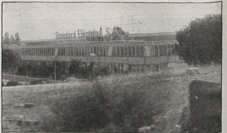
Standard Eléctrica ha solicitado expediente de regulación de empleo para 1.344 trabajadores

Las razones que exponen CC. OO. y UGT para oponerse al expediente son: incumple los acuerdos del 7 de mayo; desde el punto de vista econó-