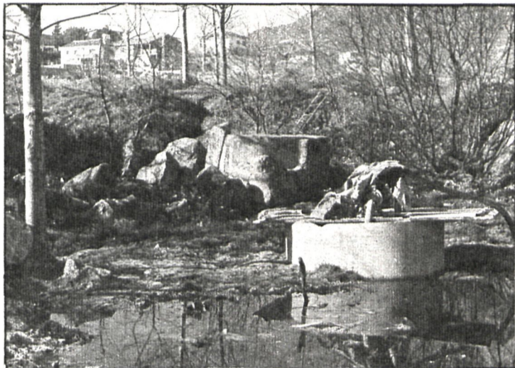
Los propietarios de los chalés construidos a las afueras de la Cabrera son los únicos que han realizado el enganche a la red de suministro de agua

Por otra parte, según estudios aproximativos del Ayuntamiento, las obras de la acometida y enganche se elevarían a 35.000 pesetas, incluido el impuesto industrial, precio que se abarataría por tratarse de una obra colectiva y ser muchos los beneficiarios de las obras, «pero nadie se explica cómo pretenden elevar los precios al triple de su coste. Todo