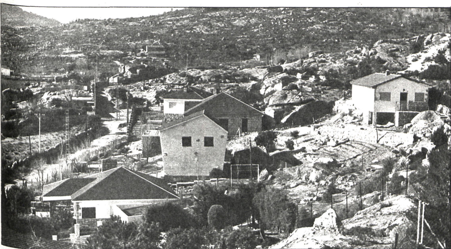
A finales de agosto