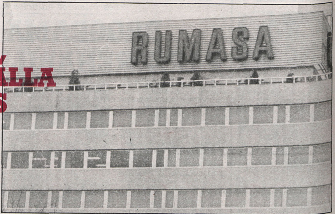
La caída del beneficio neto es consecuencia del aumento del precio de las materias primas y los suministros exteriores, según los empresarios

— El sistema de contabilidad empresarial, al igual que la mayoría de los otros países, está pensado para períodos de estabilidad de precios y no para períodos de gran inflación y crisis económica.