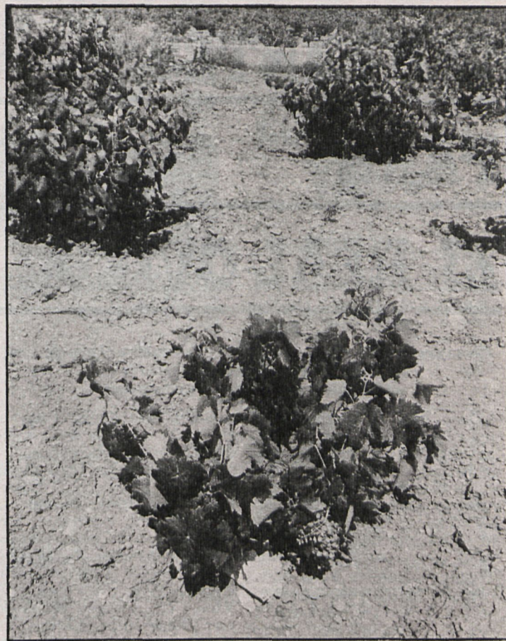
En las últimas elecciones a Cámaras Agrarias, la izquierda alcanzó mejores resultados en la zona del Suroeste, donde hay abundantes plantaciones de viñedos

La Federación de Trabajadores de la Tierra sería teóricamente la segunda fuerza sindical en el campo de la región madrileña, si bien es preciso hacer una puntualización. En la FTT tienen cabida tanto los