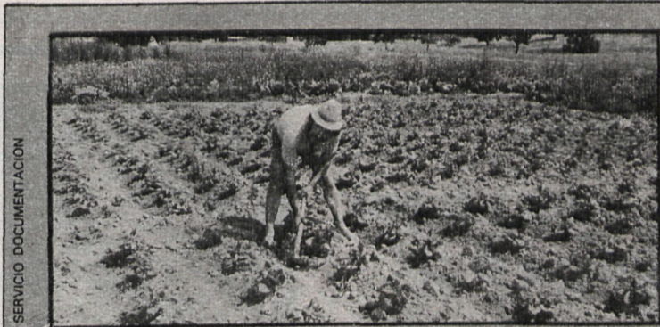
Las zonas de las vegas y las huertas son las que registran un mayor índice de afiliación a los sindicatos agrarios madrileños