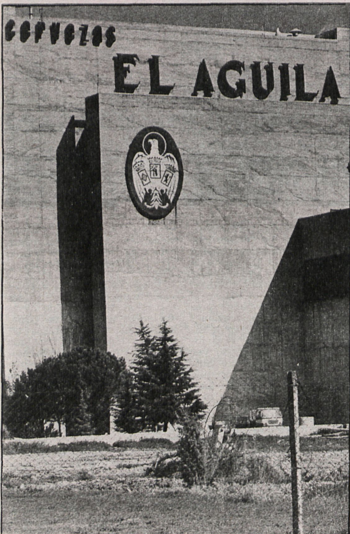
Los empresarios españoles dicen que se han convertido en simples cajeros en busca de dinero para sus empresas

En el incremento del coste salarial por empresas, Madrid se situó en el término medio (13,45 por 100), dado que la media nacional fue del 13,90 por 100.