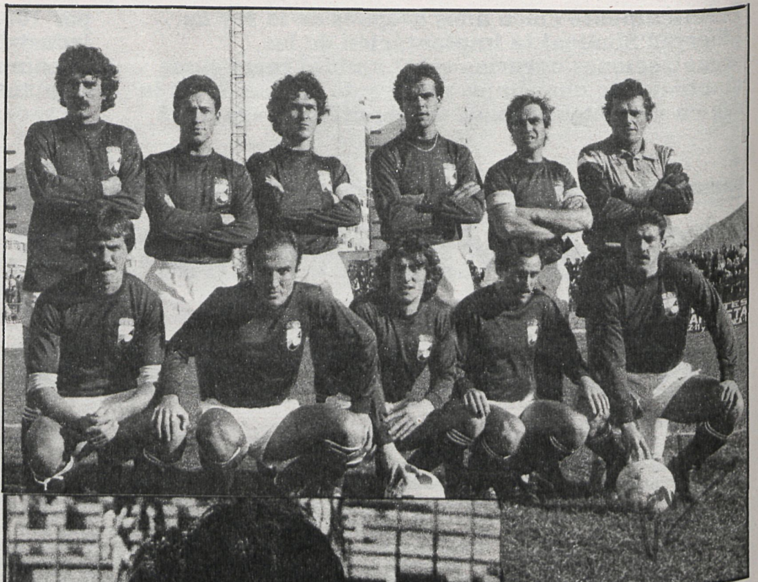
Equipo de la Real Sociedad Deportiva de Alcalá, en una formación de la temporada pasada