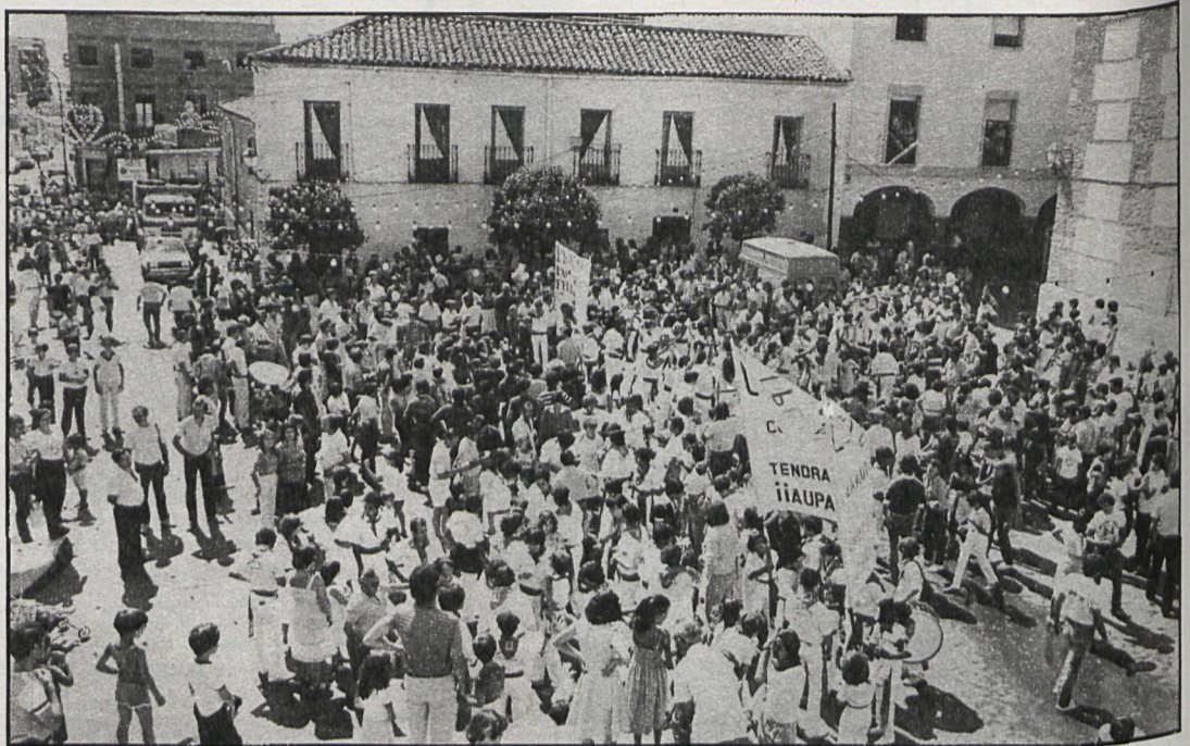
El público de San Sebastián se ha volcado en las fiestas patronales desde el primer día. En la foto, aspecto que ofrecía la plaza del Ayuntamiento momentos antes del pregón