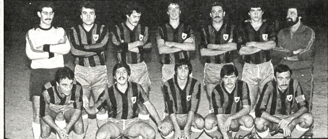
El equipo de Parla afronta este encuentro con tranquilidad