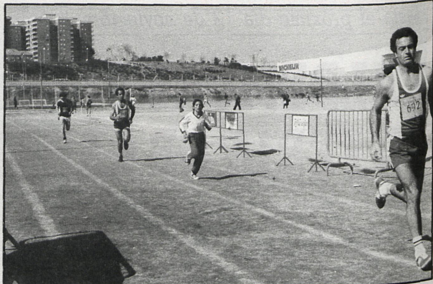
Las calles del municipio se convierten frecuentemente en pistas de atletismo, mientras que las instalaciones deportivas existentes son cada vez más utilizadas