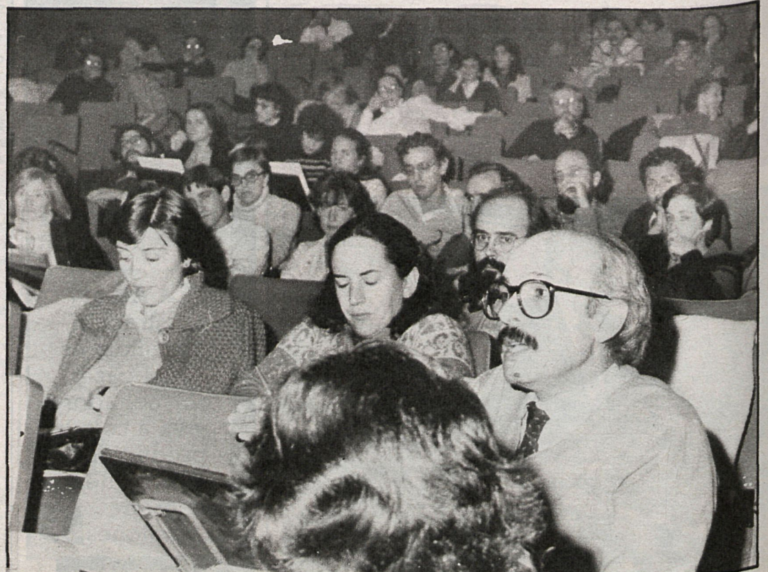
Las jornadas fueron seguidas por numeroso público