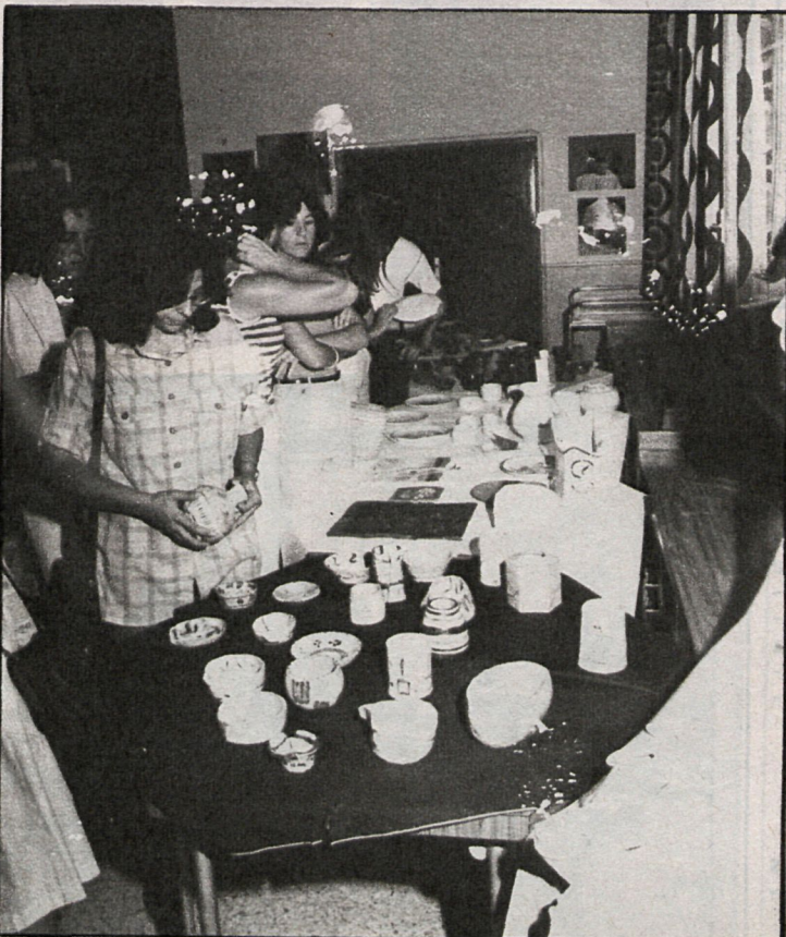
La cerámica constituye una de las enseñanzas más aceptadas dentro de las impartidas por la Universidad Popular

Los actos que se celebrarán dentro de la Semana Cultural son: