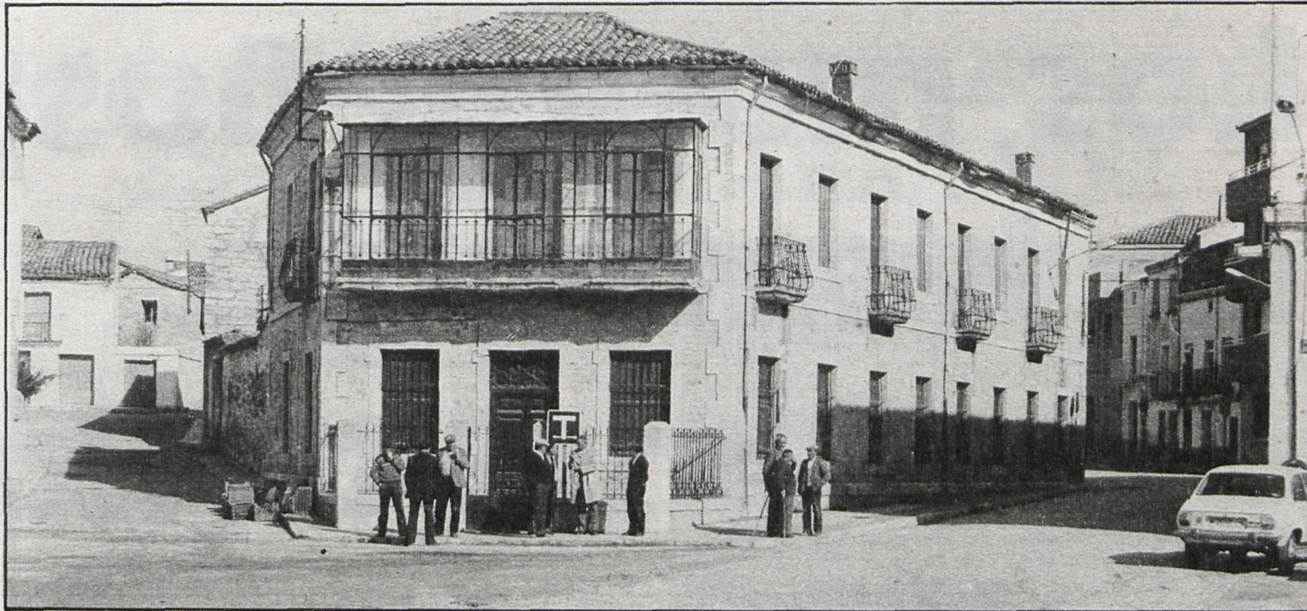
El Molar es un municipio dedicado, sobre todo, a la actividad ganadera

La acogida del local ha sido entusiasta por los vecinos, ya que es la primera biblioteca que existe en la localidad.