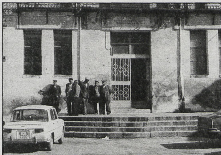
Cerca de doscientos vecinos de El Molar acudieron al Ayuntamiento para obtener información de los proyectos existentes en torno a la Dehesa

La Dehesa, cedida al pueblo por su antigua dueña, cuenta con una urbanización de chalets que, al parecer, reporta pocos beneficios a El Molar y un