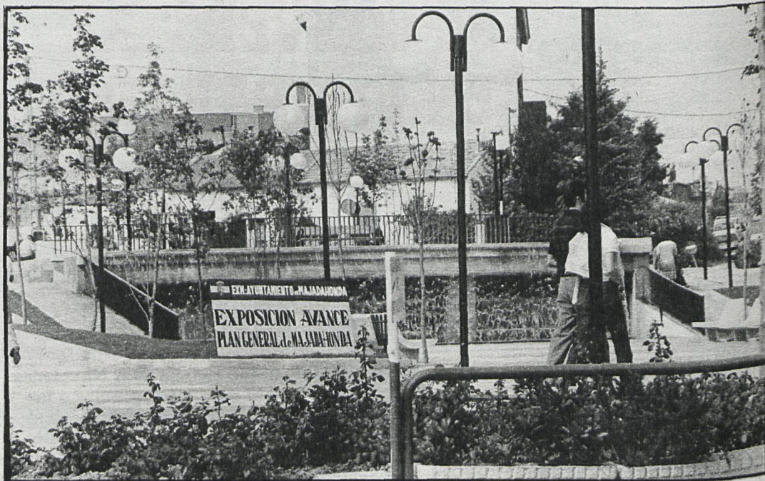
El plan general constituye un instrumento fundamental para el desarrollo armónico del municipio

—Mi política sigue siendo la misma que la de los alcaldes que me han precedido, ya que, como todo el mundo sabe, hay propietarios que pretenden construir en el monte de El Pilar, que es actualmente un bosque de pinos, un número bastante elevado de viviendas y además traspasar al Ayuntamiento la responsabilidad del