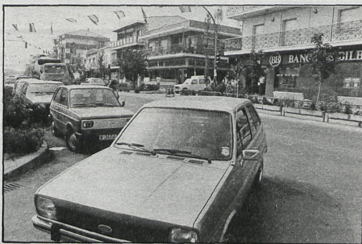
Actualmente el tráfico por el centro de Majadahonda es muy intenso

sus distintos destinos. Así, por ejemplo, Majadahonda tiene que sufrir el que por la Gran Vía, que es prácticamente el centro de la ciudad, transcurre todo el tráfico que, procedente de Boadilla del Monte y de su entorno, se dirige a Madrid y que tenga forzosamente que atravesar la Gran Vía y exactamente sucede, pero a la inversa, con todo el tráfico que, procedente de Las Rozas y El Escorial, se dirige a Boadilla. La solución a esto la tenemos en tres grandes proyectos que están ya aprobados y espe-