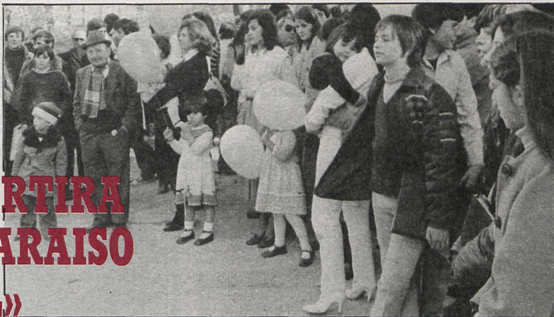
Los festivales infantiles constituyen una de las atracciones para los niños de Parla durante estas fiestas

El día 30 se celebrará un concurso de villancicos a las once de la mañana. Participarán los alumnos de los colegios públicos y privados de Parla. Habrá diversos premios, que se entregarán el día 2 de enero, para los alumnos de los diferentes colegios, de preescolar, de guarderías, etc.