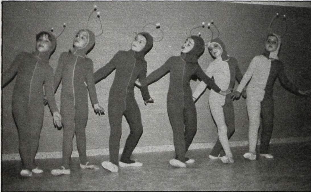
Durante los tres días que durará Chiquilandia, los pequeños alcaláinos tendrán oportunidad de divertirse de lo lindo

avance en cuanto a la atención que por parte del Ayuntamiento se dedica a los niños de la localidad.