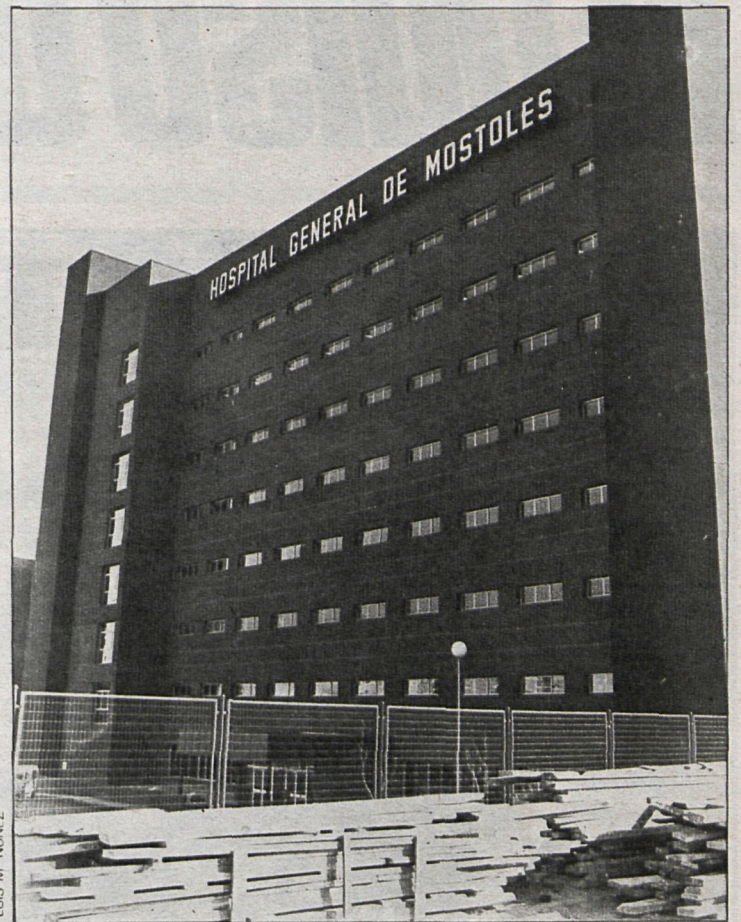
Dentro de mes y medio, los pasillos y consultas del hospital recién terminado acogerán a los enfermos del área sudoeste de la provincia

según las autoridades sanitarias y las locales, deberán estar resueltas antes del 15 de febrero, tales como las vías de acceso, ya que, por el momento, se dispone solamente del interior de Mostoles, con un nivel de tráfico de por sí bastante elevado. Se espera que se pueda acceder al hospital directamente desde la carretera nacional V, señalando el alcalde de Mostoles que estos inconvenientes deberían estar contemplados en los proyectos inicia-