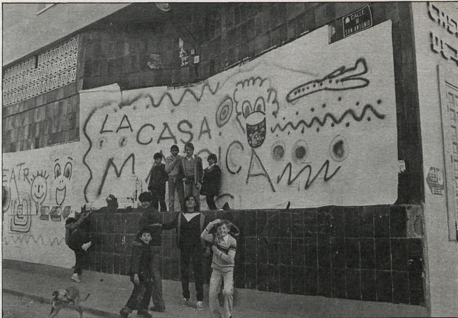
En Móstoles, del 24 de diciembre al 6 de enero, se transformó en la «Casa Mágica»

■ El día 5, a partir de las ocho de la tarde, tuvo lugar en Navalcarnero la tradicional cabalgata de Reyes, patrocinada por el Ayuntamiento y organizada por la Asociación RAC Amigos de Navalcarnero, partiendo de los locales de la Asociación y recorriendo las principales calles de la localidad. El día 6 tuvo lugar una gran fiesta infantil en el aula de teatro de dicha Asociación, con música, bailes, juguetes, regalos y payasos.