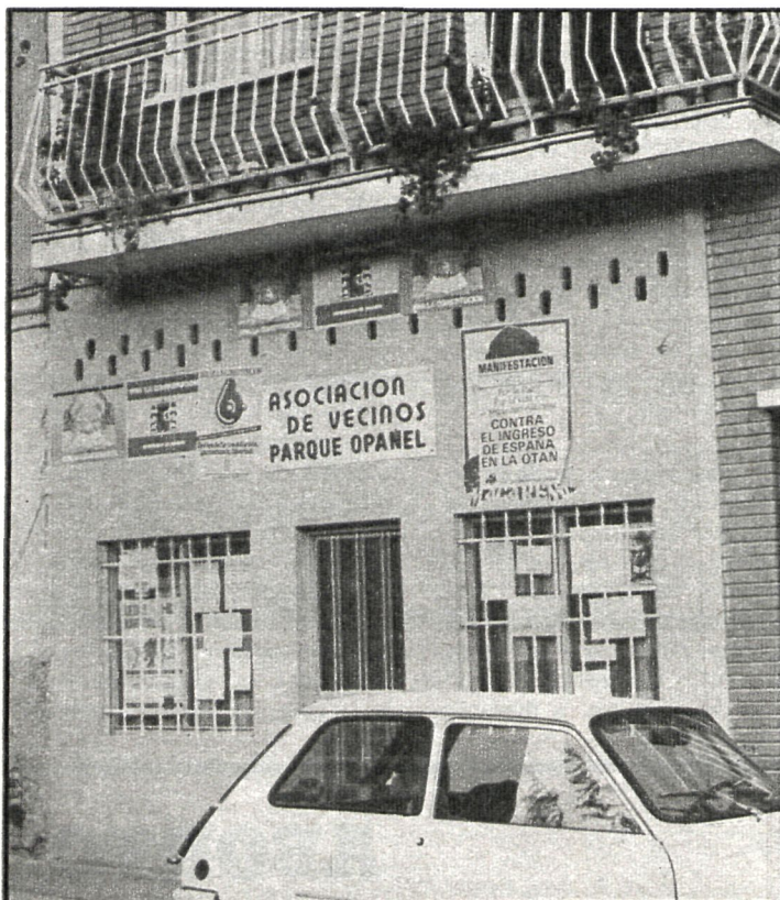
Las asociaciones de vecinos incidirán en su labor reivindicativa, según se desprende de las conclusiones del XIV Encuentro Estatal

En las conclusiones finales de los encuentros, la creación de la coordinadora a nivel estatal fue lo más destacable, aunque en un principio hubo cierta oposición por parte de la Federación de Barcelona. Esta coordinadora tendrá representantes de todas las federaciones, teniendo en cuenta el número de asociaciones, y se pondrá a trabajar de inmediato en una campaña para favorecer el asociacionismo y organización de los ciudadanos, que se desa-