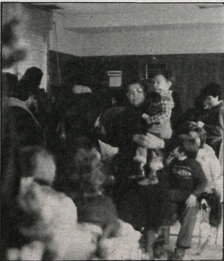
Seis médicos atienden la especialidad de pediatría en los dos centros de la Seguridad Social existentes en la localidad. El número de niños que reciben diariamente cada uno de ellos llega a veces a 180

Se carece de dotación médica suficiente para atender el servicio de urgencias y la asistencia pediátrica