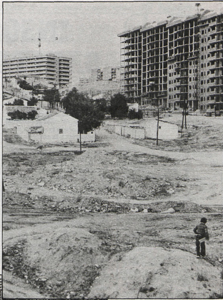
Hasta el momento se han entregado 5.000 viviendas del plan de remodelación, hay 14.000 en construcción y quedan por iniciar las obras de 13.000

En el caso de viviendas que ya están habitadas hay situaciones en las que el Ministerio no ha pasado ningún recibo desde hace tres años, con lo cual los vecinos se preguntan qué van a hacer si un buen día les pasan todos los recibos de golpe, aunque los propios be-