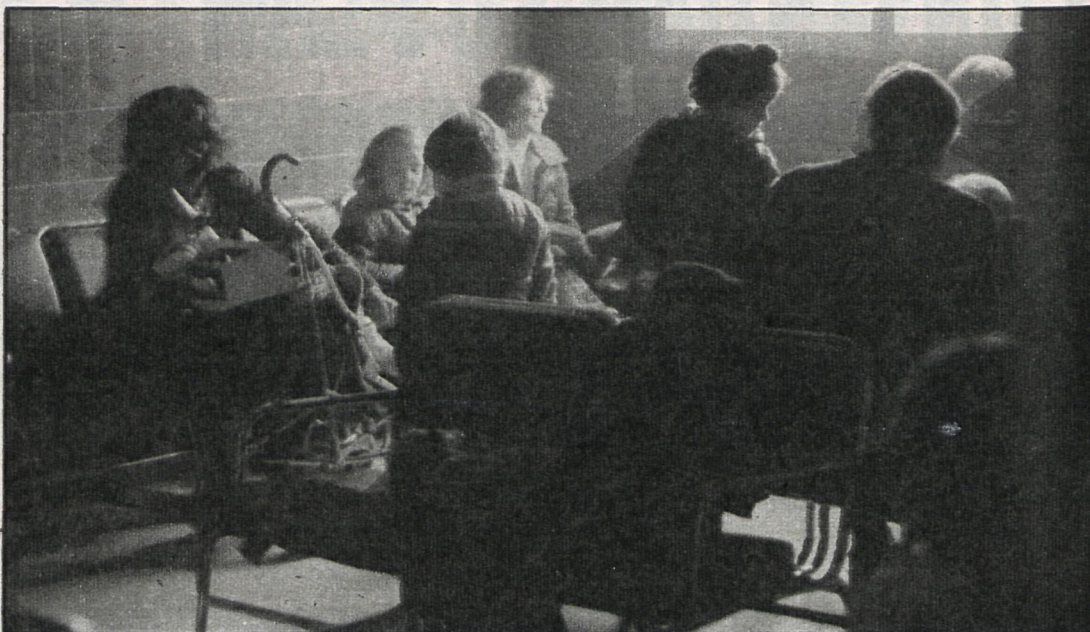
El alto índice de población en Fuenlabrada hace que por falta de infraestructura se colapsen las consultas frecuentemente