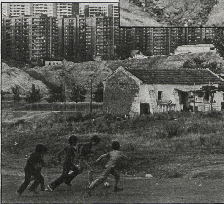
Los nuevos edificios permiten mejorar sensiblemente la calidad de vida de numerosos ciudadanos residentes en viviendas inadecuadas

Por otro lado, los problemas de las viviendas que están en construcción y de las que in-