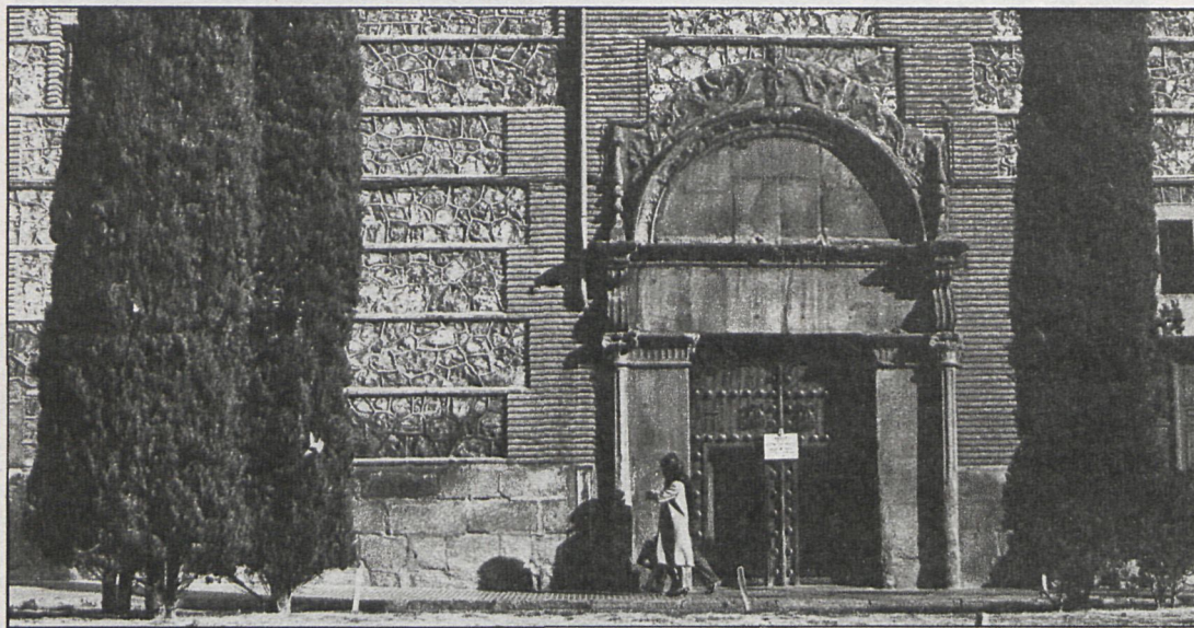
El edificio de las Descalzas constituye uno de los restos arquitectónicos de la época comprendidos en el fin del periodo ojival y la plenitud del Renacimiento