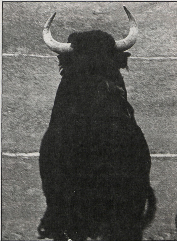
El toro íntegro, de bella estampa, insolente trapío, casta brava, ha sido el protagonista de la feria de Valdemorillo