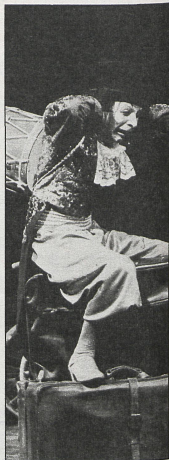
La fotografía recoge un momento de la obra de Shakespeare «El rey Lear»

Lo que ha querido descubrirnos el montaje de Miguel Narros es que «El rey Lear» es una «pieza sobre el poder», y en esto, naturalmente, diferimos. Que todo clásico tenga