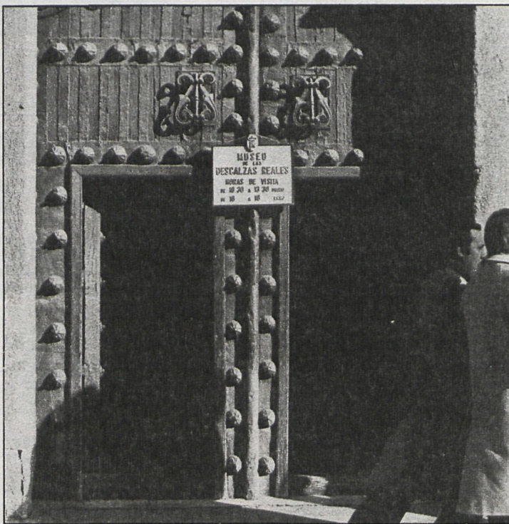
Desde el siglo XVI las franciscanas clarisas ocupan el convento, donde han conservado una de las colecciones privadas más importantes dentro de las bellas artes

Doña Juana escogió para su cenobio religiosas franciscanas descalzas de Santa Clara por su pobreza y humildad. En 1559 tomaron posesión del convento. La extensión del monasterio entonces era mayor y comprendía una residencia de capellanes y maestros de la capilla de música, un orfanato de niñas, una tahona (donde llevaban las jóvenes casaderas madrileñas docenas de huevos para que sus yemas fueran edulcoradas por las religiosas y que éstas rogaran que hiciera buen tiempo el día de la boda) y una casa de la misericordia