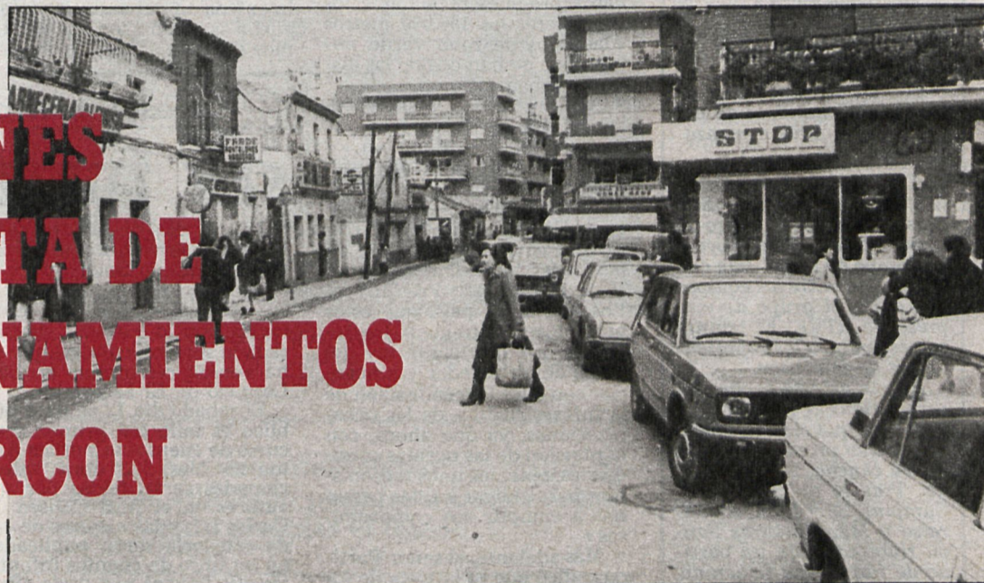
La falta de aparcamientos se hace sentir ya en localidades del Area Metropolitana, como Alcorcón, donde se están tomando medidas para resolver el problema

Por otra parte, preocupa también la incidencia que la falta de aparcamientos puede provocar entorpeciendo el trabajo de los diferentes servicios de la comunidad, como es el caso de los bomberos, que tienen numerosas dificultades para desplazarse con los