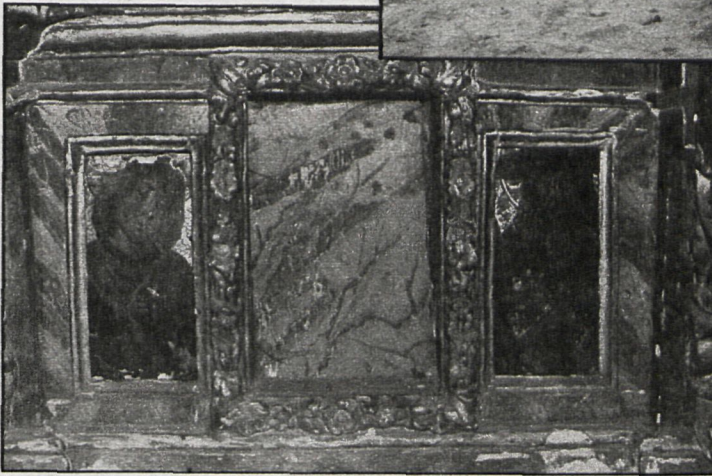
AURORA DE LUCAS