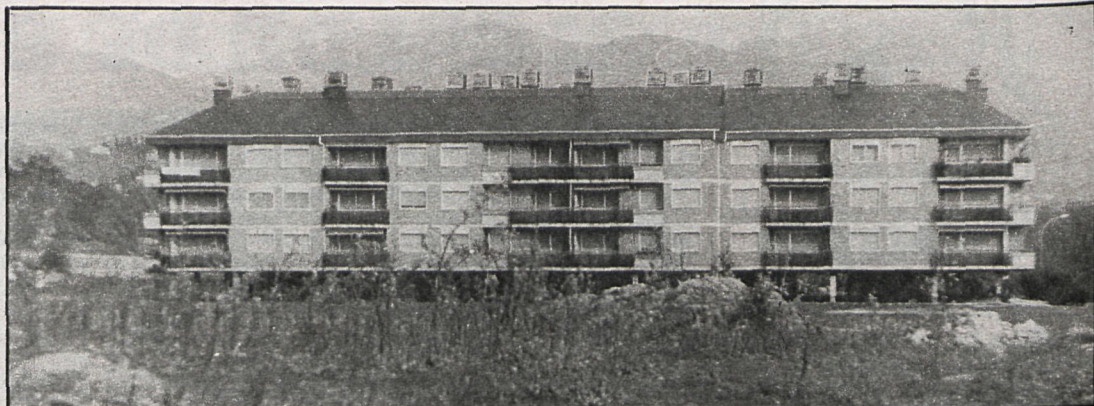
Una de las urbanizaciones de Los Molinos que tendrán que ceder terreno para zona verde. Al fondo, la sierra