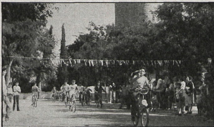
Las pruebas ciclistas populares constituyen una de las actividades deportivas habituales en el municipio

ponde bien a la llamada al deporte popular, sobre todo al fútbol. Nosotros intentamos que otros deportes superen el nivel de aceptación. En este sentido puedo decir que el baloncesto está tomando un gran auge.» Otras manifestaciones del deporte popular se dan con la realización del Día de la Bicicleta, cursos de natación, campamentos de verano y la petanca para los ya entrados en edad.