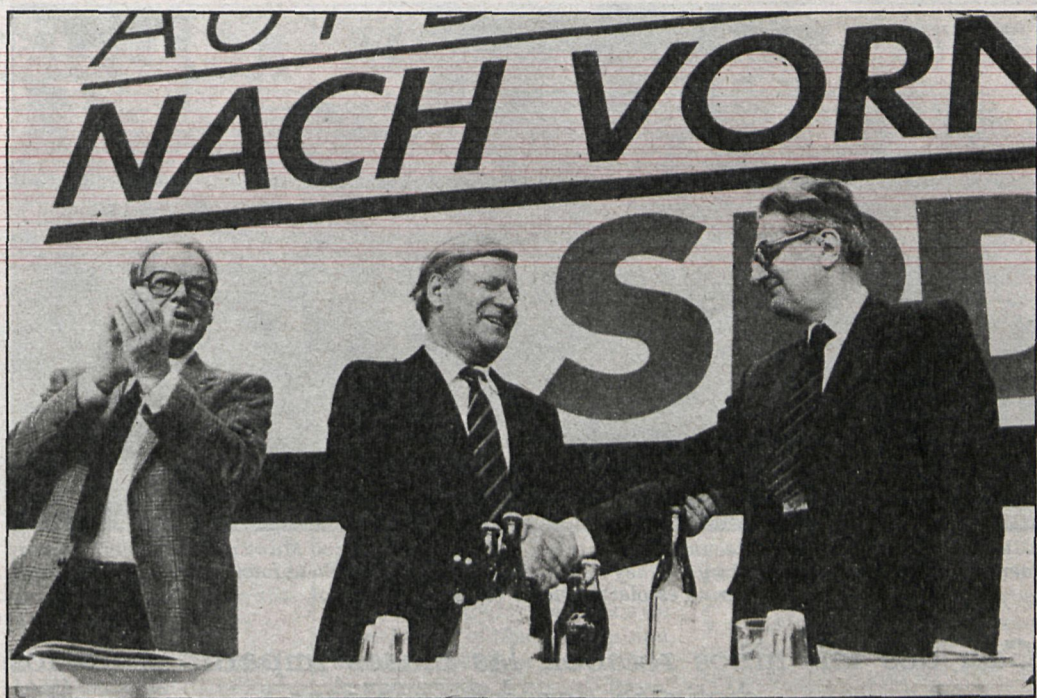
Vogel y Schmidt se saludan; Willy Brandt aplaude

Para más información dirigirse a la Embajada de México, calle Orense, número 58, de Madrid.