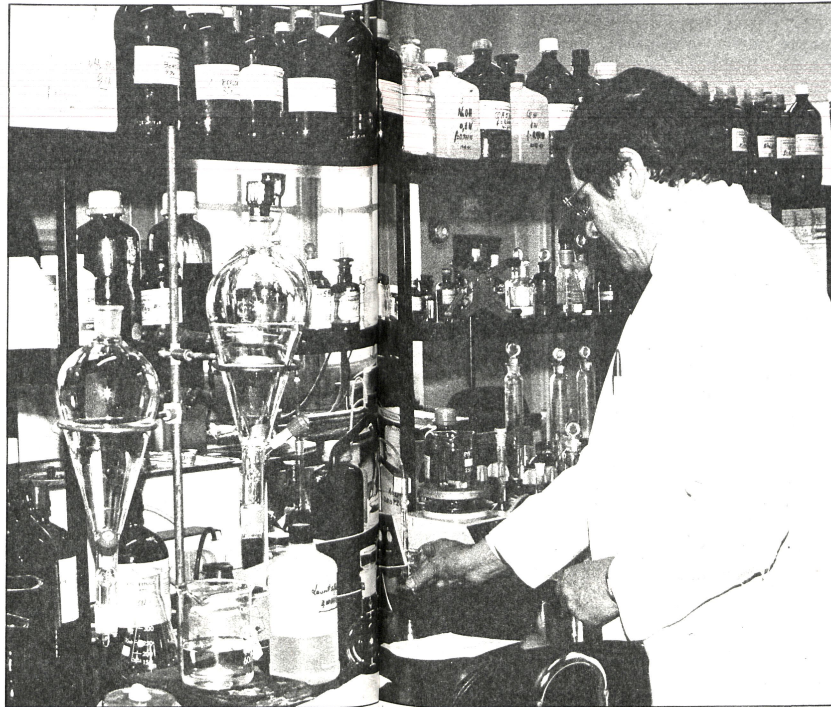
En agosto de 1877 se inauguró lo que en principio fue el Laboratorio Municipal más importante de Europa, el de Madrid. Seis meses más tarde se inauguró el de París. Desde entonces hasta ahora las cosas han evolucionado mucho

Entre las funciones que desempeña en la actualidad el laboratorio, además de las de vacunación infantil, dentro de la constante campaña de medicina preventiva, se utilizan técnicas de absorción atómica, radiactividad, polarografía, cromatografía líquido-líquido, en capa fina y de gases, y espectrofotometría. Esto da una gran viabilidad a su funciona-