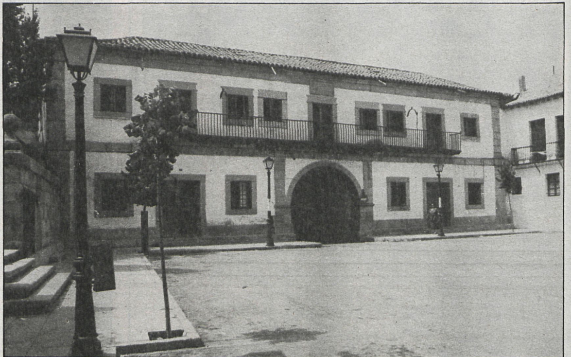
El resumen del balance de la gestión municipal recoge la actividad del Ayuntamiento desde 1979 hasta el presente año

Asimismo se da cuenta en el informe público de la Comisión de Hacienda de las principales realizaciones ejecutadas durante el mandato de la actual corporación. Por su importe, hay que destacar el capítulo dedicado a la pavimentación, saneamiento, acerado y redes de agua de distintas zonas de la localidad, en lo que se invirtieron 24 millones, así como los 17 dedicados a la construcción de un colector para su conexión a la depuradora. También hay una especial referencia al capítulo dedicado a la organización de actos culturales y deportivos, creación del Patronato Municipal de Deportes, Biblioteca Municipal, reparación y acondicionamiento de pistas polideportivas, alumbrado y construcción de un frontón, en lo que el Ayuntamiento de San Martín ha in-