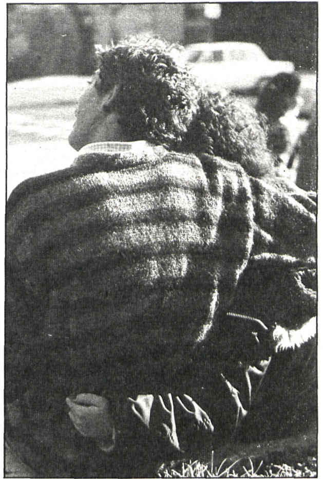
Los jóvenes, que muestran ideas conservadoras respecto a la familia y al matrimonio, adoptan posturas liberales y progresistas en todo lo que se refiere a las libertades personales

Progresistas en lo político, pacifistas en sus relaciones con los demás y esperanzados con el futuro