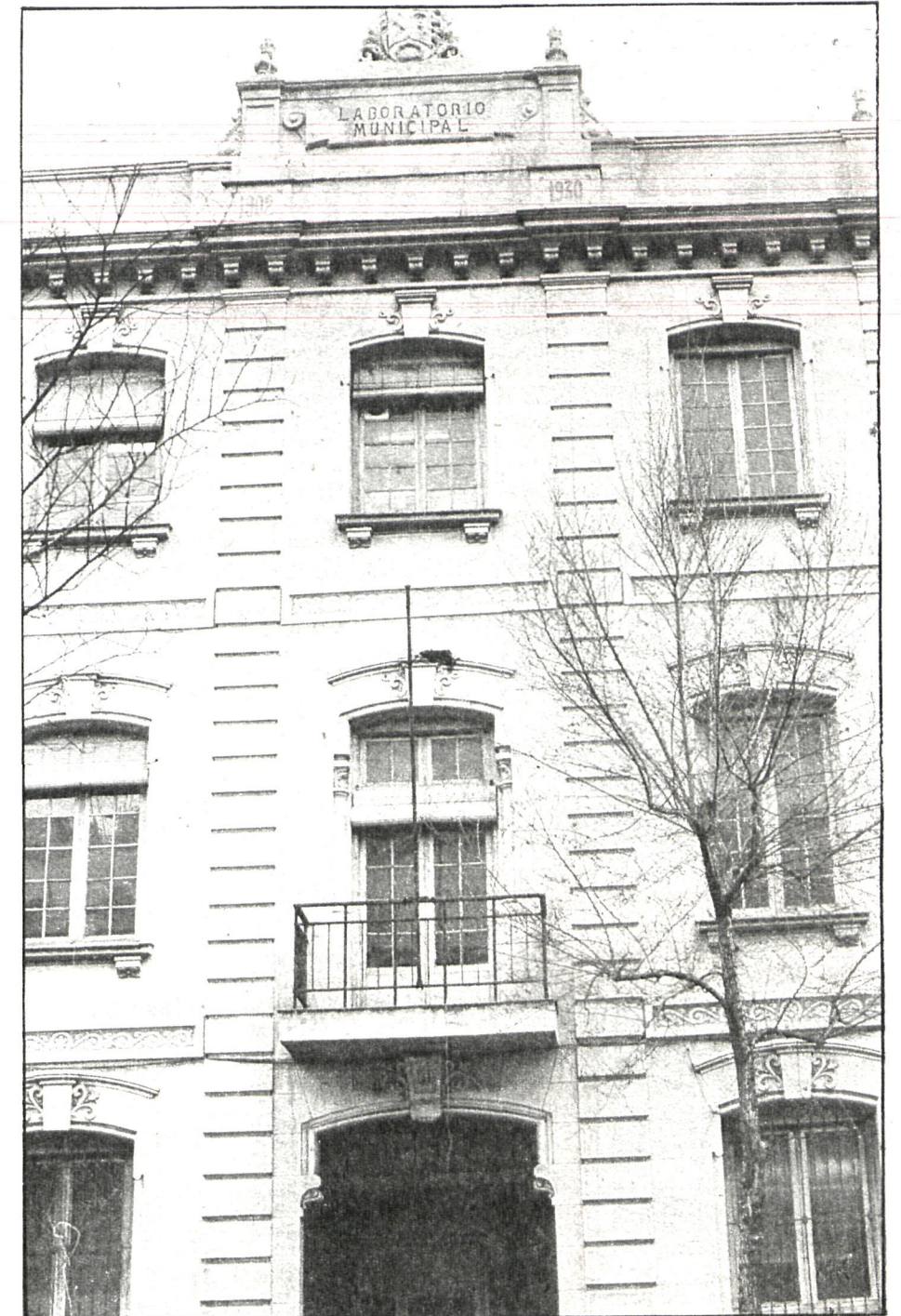
El Laboratorio Municipal de Madrid se encuentra actualmente en la calle Bailén, número 41, después de haber ocupado dos sedes anteriormente