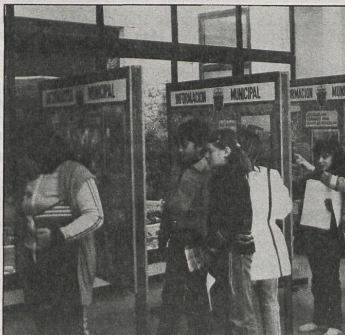
Cinco paneles con textos e ilustraciones fotográficas informan a los vecinos de las realizaciones municipales

ción de vecinos, clubes deportivos y demás organizaciones comunitarias, poniendo a su disposición un programa de exhibición de videos realizados por el taller audiovisual de la Casa de Cultura. Por el mo-