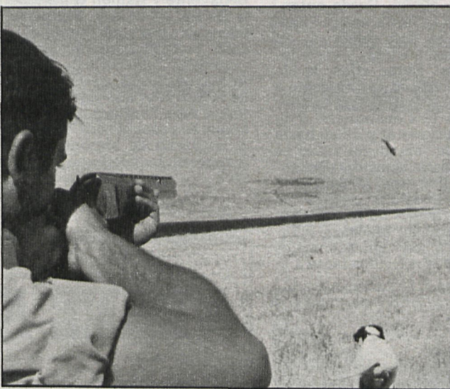
El Campillo, lugar idóneo para abatir faisanes, perdices y codornices en toda época

Son irreconciliables las posturas que se mantienen por parte de los aficionados sobre este tipo de caza. La avanzadilla de las críticas se cifran en la falta de bravío de las especies que allí se abaten. En nuestra opinión, y sin poner en duda que hay perdices más próximas a gallinas de corral que a