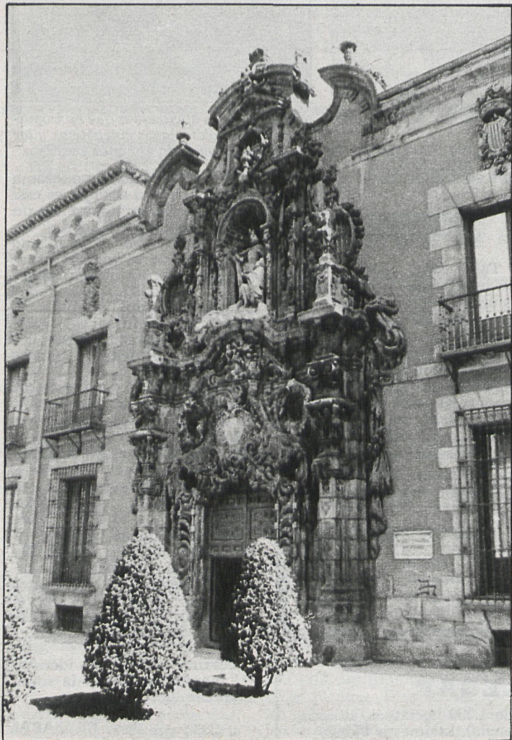
Pórtico barroco de Pedro de Rivera, que da paso al Museo Municipal