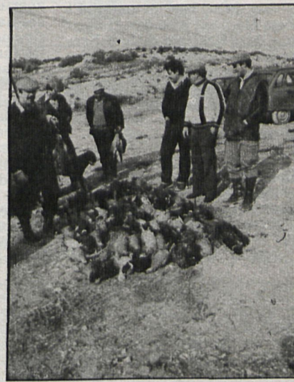
Muchos son los aficionados que han optado por las explotaciones cinegéticas y los resultados son cada vez más positivos

piezas montaraces con capacidad de lucha, éste no es el caso de El Campillo, a tenor de unas pruebas prácticas que para CISNEROS realizamos en el centro cinegético. Muy experto tiene que ser un cazador para diferenciar entre éstas y las nacidas en libertad. Sin tomar partido por una u otra postura sería recomendable que antes de emitir una opinión se cazase en esos terrenos para así tener más elementos de juicio. En todo caso, la existencia de cazaderos artificiales no obliga a ejercitarnos en ellos. Ojalá sigan siendo, por mucho tiempo,