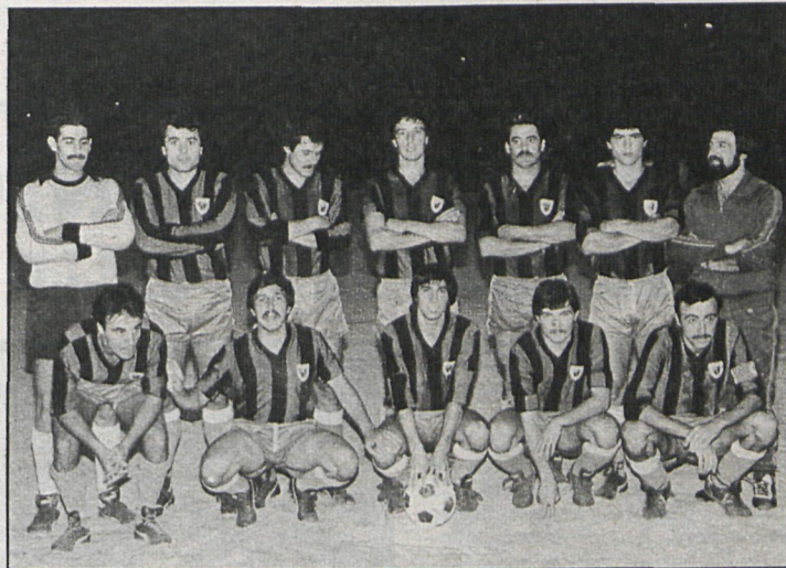
El Parla, auténtico compromiso para el Torrejón

Getafe-Gimnástica Segoviana. — Los titulares del Getafe