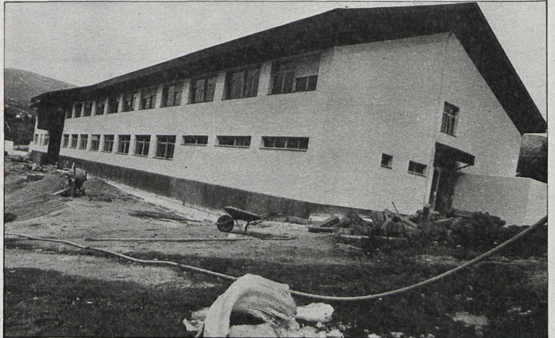
Esta es una de las dos naves de la escuela de formación profesional de Cercedilla, que dará cabida a más de 600 alumnos

Este centro de Cercedilla presenta igualmente otras innovaciones, como es el caso de la creación de un patronato en el que estén representados el mayor número de organismos posible: ayuntamientos de la comarca, Diputación de Madrid, representantes de los Ministerios de Educación, Obras Públicas, Agricultura, del Instituto Nacional de Industria, de la Escuela Superior de Mon-