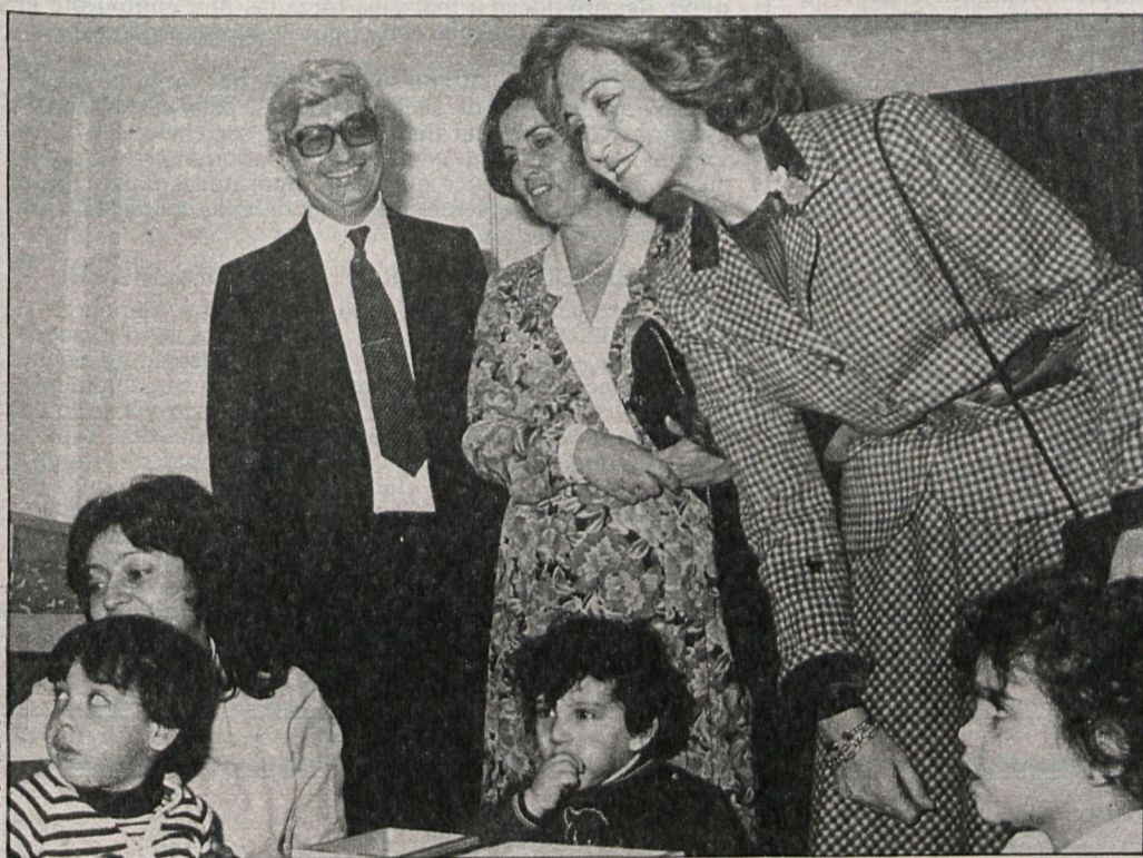
Las nuevas instalaciones, situadas en la Ciudad Escolar de la Diputación, sustituyen a la antigua Inclusa