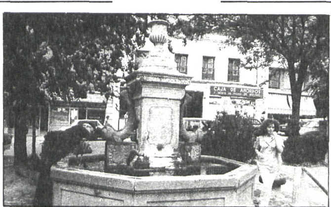
La fuente, construida en 1852 para dar agua a la población, costó en su época 14.000 pesetas

La Delegación de Tráfico y Transportes espera que se pueda circular con fluidez y comodidad gracias a las mejoras señaladas anteriormente, así como con la instalación de siete nuevos semáforos que se han colocado en importantes intersecciones, que se esperan entren en funcionamiento durante Semana Santa, una vez que se hayan realizado las acometidas y empalmes de luz. Para este capítulo, el Ayuntamiento