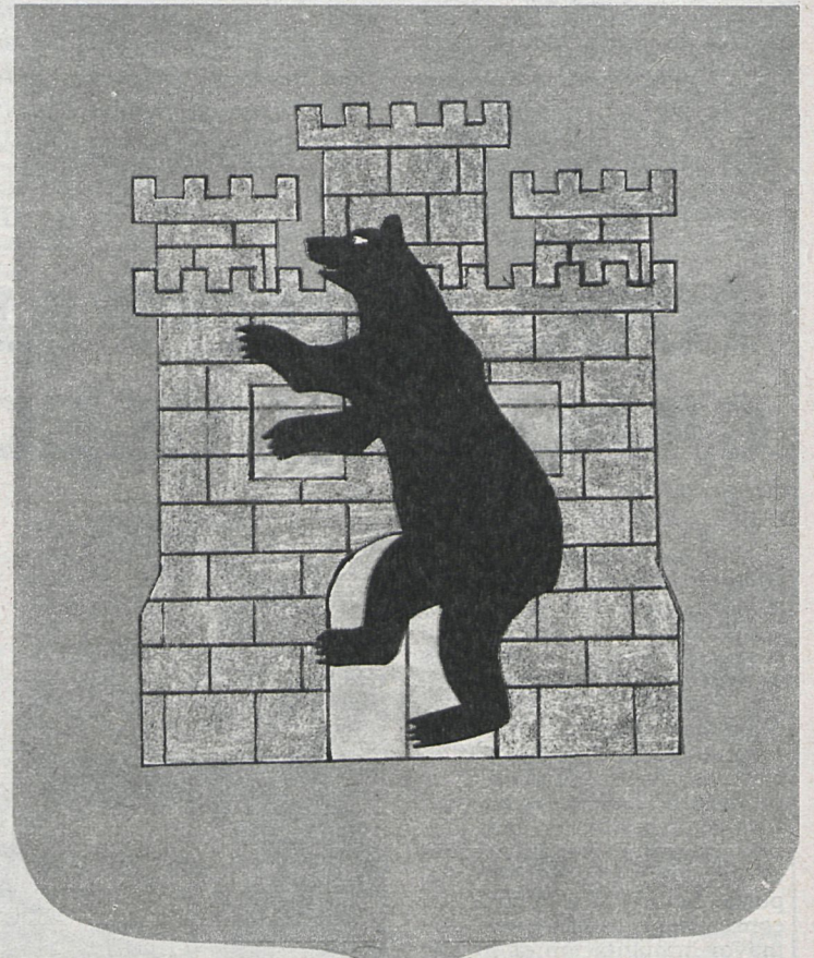
Dibujo núm. 1

La provincia, además, desde que se estableció la división