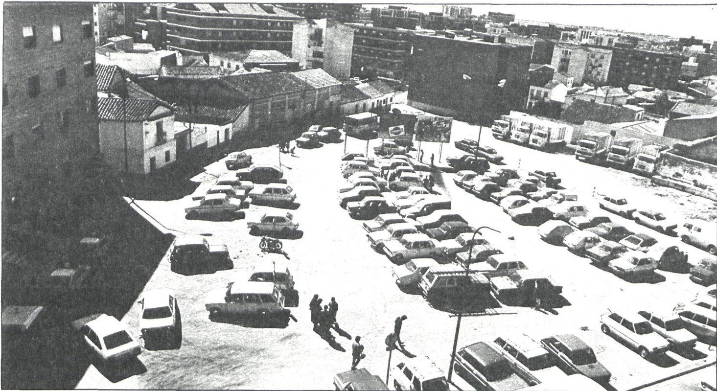
Lograr un tráfico más fluido y habilitar una mayor cantidad de aparcamientos, es el objetivo del proyecto

El Centro Cultural de Griñón está estudiando la posibilidad de proyectar películas infantiles todos los domingos, a las seis de la tarde, en sus locales, ante la grata acogida que tuvieron las proyecciones efectuadas en las últimas Navidades. El precio de las entradas sería de 25 pesetas. También parece posible que se organice una serie de ciclos para jóvenes mayores de catorce años un domingo al mes, celebrándose tras la proyección un coloquio sobre la película emitida.