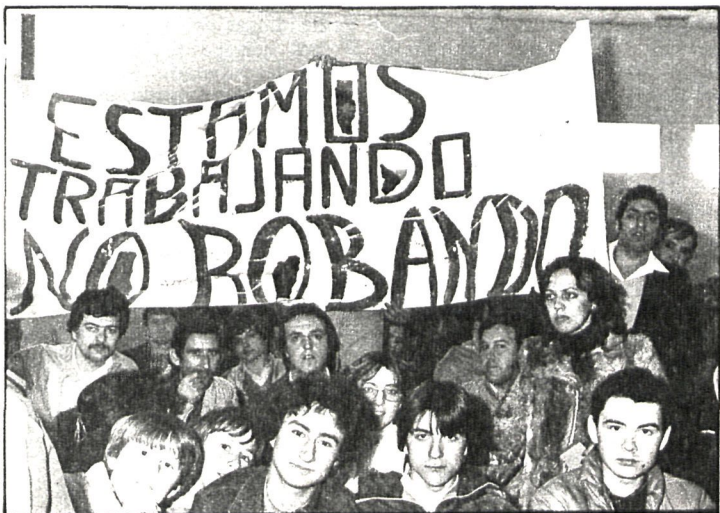
Parte de los manifestantes se encerraron el lunes en el Ayuntamiento

A la hora de cerrar esta edición de CISNEROS, no obstante, aún no se había llegado a una solución definitiva que permita solucionar este conflicto.