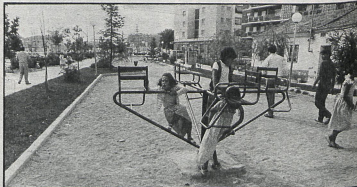
La multiplicación de parques y otros espacios públicos es un objetivo prioritario de la Corporación de Majadahonda

El proyecto aprobado por la Corporación durante un pleno extraordinario en el mes de ju-