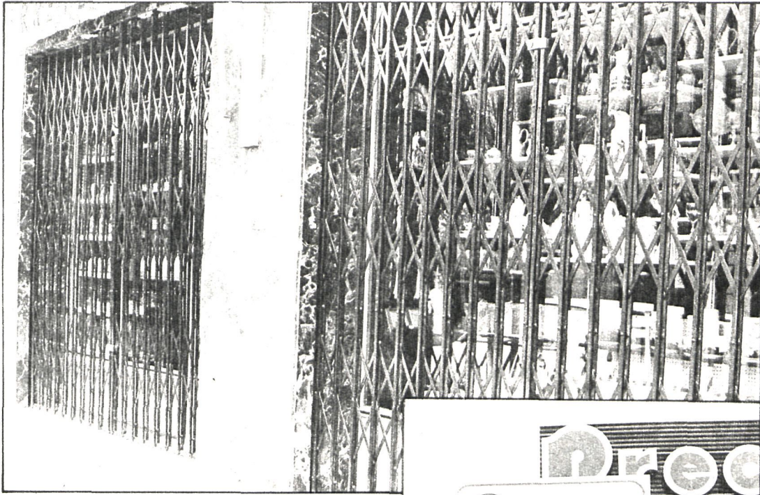
Numerosos comercios echaron sus cierras para protestar por el incumplimiento de los acuerdos suscritos con el Ayuntamiento por parte del hiper Preco

Esta conferencia se enmarca dentro del propósito del Ayuntamiento de este municipio de prevenir la adicción de los jóvenes a la droga, fenómeno que desgraciadamente se ha extendido en los últimos tiempos en esta y otras localidades españolas. Junto a los medios para prevención y rehabilitación de toxicómanas se ha puesto en funcionamiento un gran número de polideportivos, que, como dice el enunciado del tema que trató el doctor Beneit, pueden ser una eficaz alternativa a las drogas.