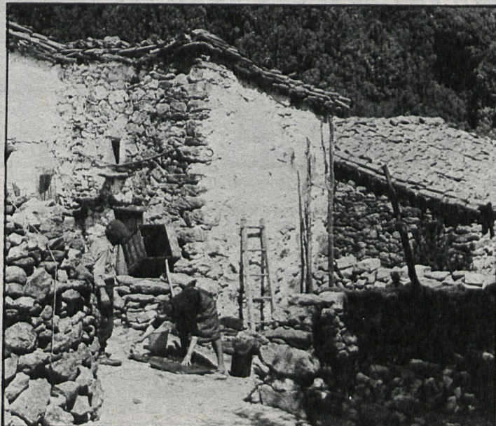
Las actuaciones municipales han estado encaminadas a dotar a la zona norte de, al menos, la infraestructura mínima

La falta de recursos en la denominada «sierra pobre», a pesar de las ayudas especiales para crear su infraestructura, obliga a la concentración escolar en las mayores poblaciones y la dependencia sanitaria ha de ser compartida por varias localidades. La existencia de pequeños núcleos rurales, con una población envejecida, y la falta de subvenciones para la creación de nuevas expectativas económicas impide el desarrollo del sector agrícola y ganadero, ocupaciones tradicionales de la zona.