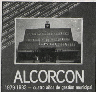
Portada del libro-balance editado por el Ayuntamiento de Alcorcón, que contiene 84 páginas

«Alcorcón cambia paso a paso», lema de la exposición que permanecerá abierta hasta el día 17 en el Centro Cívico