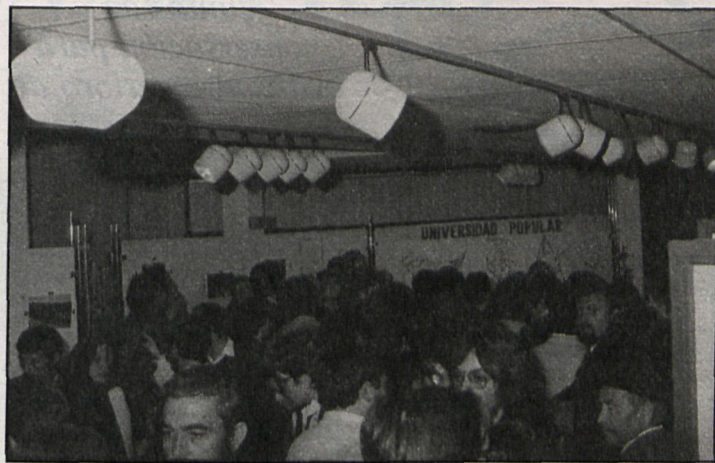
Vista general de una de las salas

Asimismo, se ha presentado, coincidiendo con la inaugura-