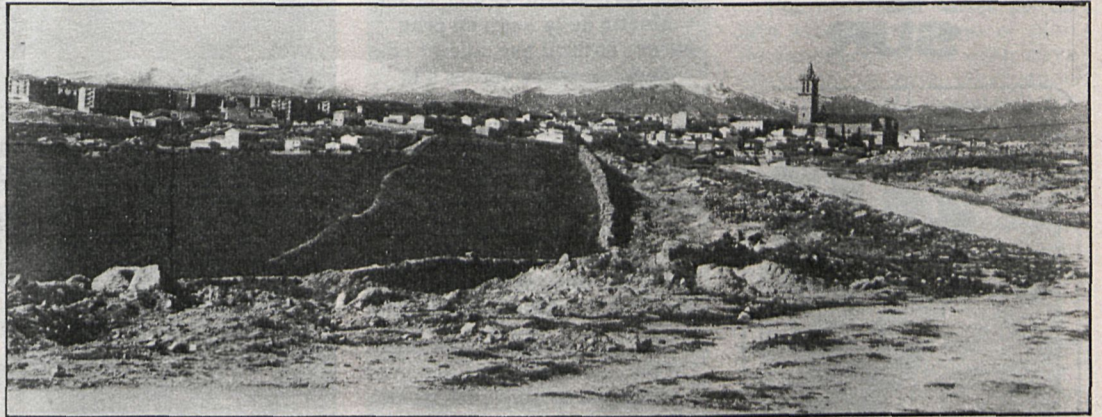
El yacimiento fue descubierto por un aficionado a la espeleología