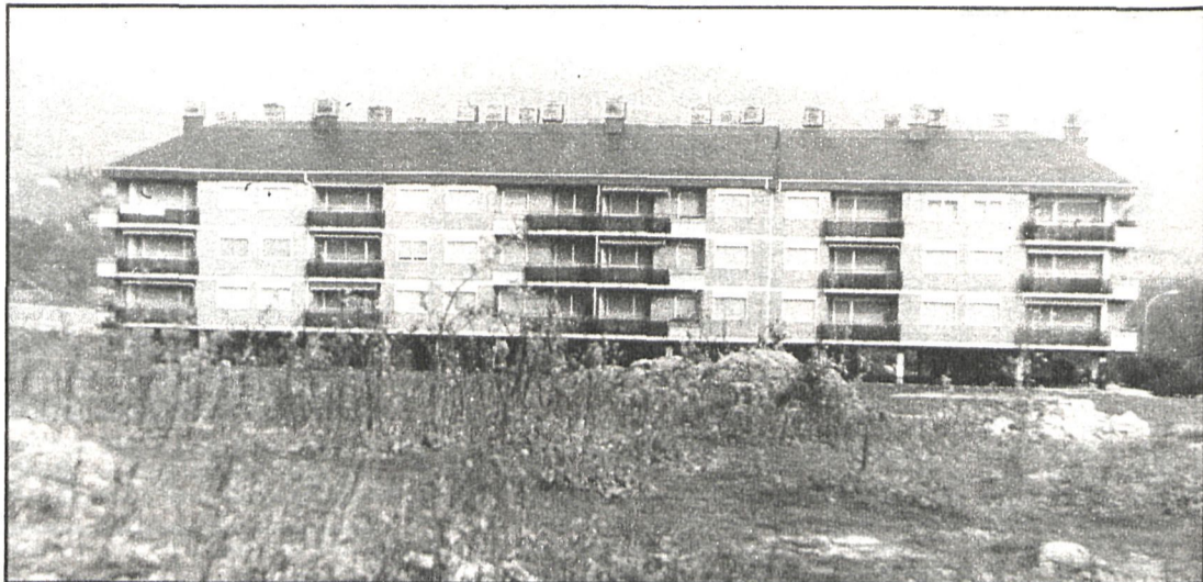
Los terrenos que deberán ceder las urbanizaciones serán para uso colectivo

«En estas reuniones —añadió el señor Partida— les hemos dicho que en aquellos polígonos que sean de un solo