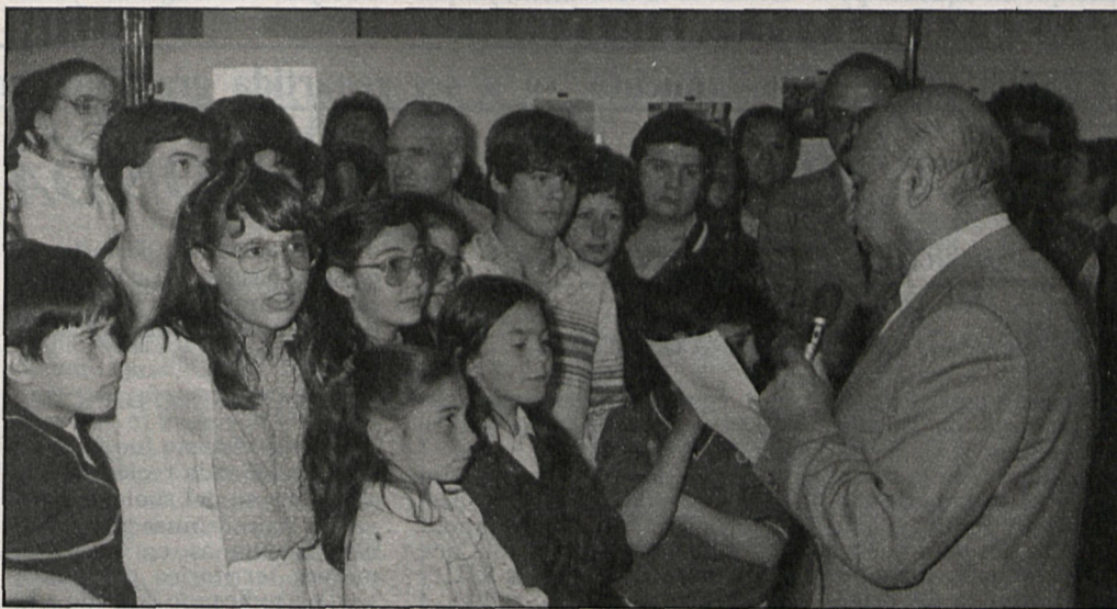
José Aranda, alcalde de Alcorcón, durante la jornada inaugural de la exposición. A la derecha, el «stand» dedicado a la Policía Municipal

A la inauguración de la muestra sobre la labor realizada por el Ayuntamiento estuvieron presentes el alcalde del municipio, José Aranda, y los concejales de las distintas áreas. Las salas de que se compone la exposición han sido visitadas por numeroso público, que, de esta forma, puede conocer de cerca el estado actual del municipio en el que viven.