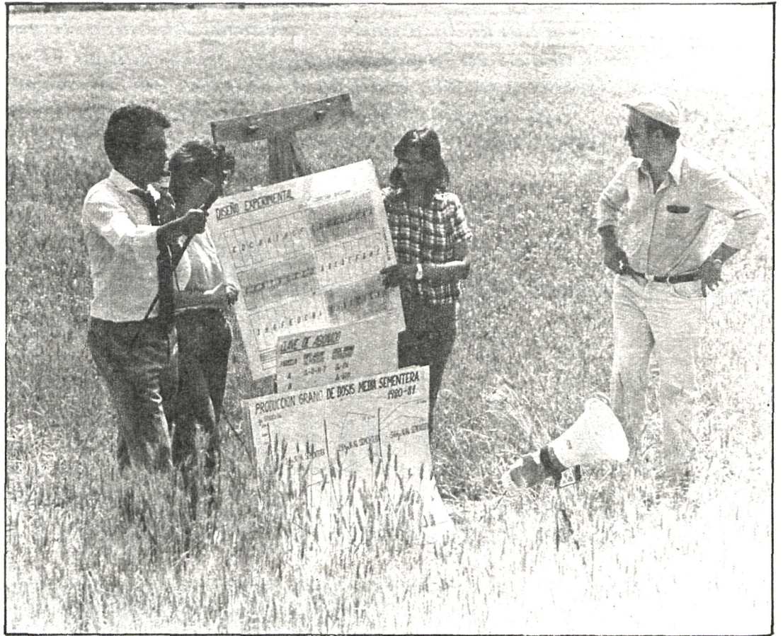
La promoción de los recursos naturales de las comarcas permitirá la elevación de la renta

Pone especial atención el programa socialista en la promoción de los recursos naturales de las comarcas que permita una elevación de la renta