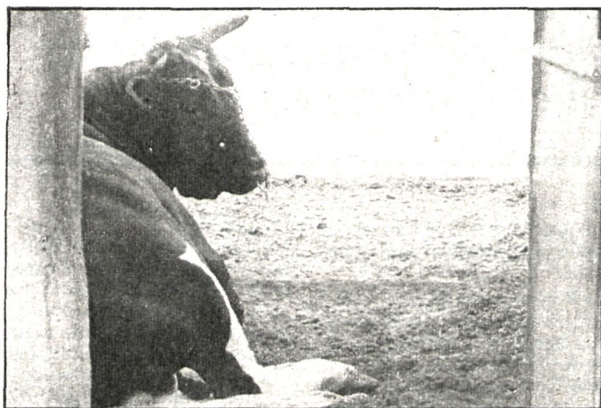
Agricultura y ganadería serán áreas a desarrollar por la Comunidad de Madrid