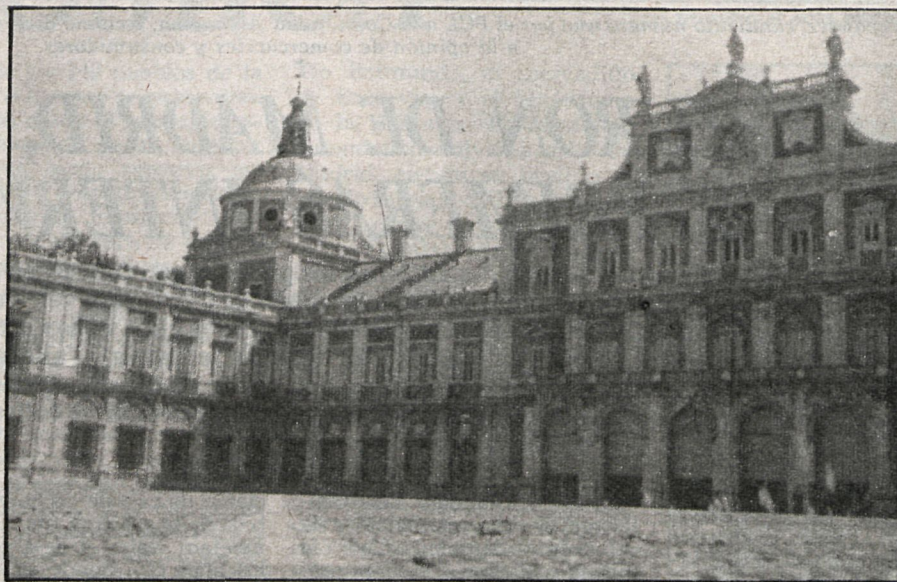
Aranjuez —afirma el autor del artículo— ha sido escenario de hechos trascendentales para la historia de España

SEMANARIO INDEPENDIENTE DE ARANJUEZ Y SU COMARCA