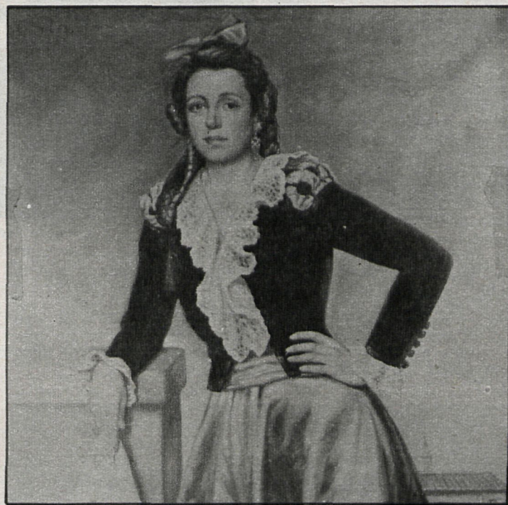
Dibujo de la legendaria Manuela Malasaña

Desde los balcones de las casas circundantes al cuartel de Monteleón y en sus calles lucharon hombres, mujeres y hasta niños de corta edad. Los más pequeños, armados con hondas y cuchillos de cocina, cortaron las bridas de los caballos y en el suelo acuchillaban a los soldados franceses. Una muchacha de diecisiete años murió de un balazo cuando le facilitaba municiones a su padre, se llamaba Manuela Malasaña; otra, de doce años, cayó ante el arco de Monteleón