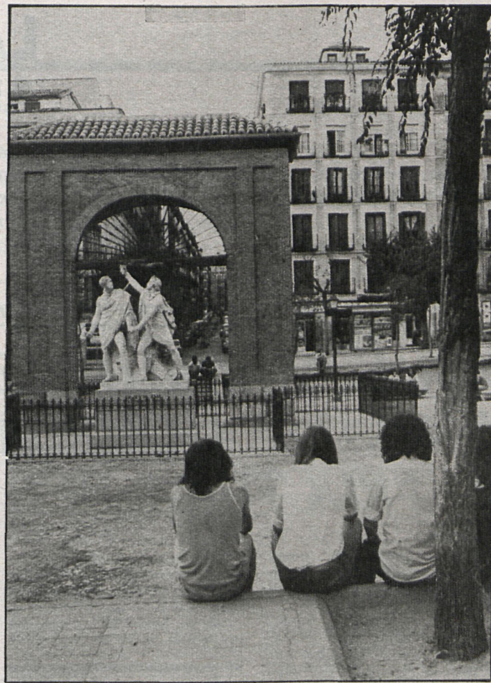
Plaza del 2 de Mayo, lugar de encuentro de la juventud madrileña

Los soldados de Napoleón, aquellos que habían vencido en todos los campos de batalla de Europa, al principio no pusieron demasiada atención en aquellos niños guerrilleros, pero el número de bajas fue tan crecido que un oficial francés, Lagrange, pidió parlamentar con el mando español del parque de Monteleón. El capitán Daoíz aceptó la tregua y en ese momento un grupo de soldados franceses se le avalanzó y lo acosó con sus bayonetas. El capitán Velarde acudió en su ayuda y un oficial polaco le