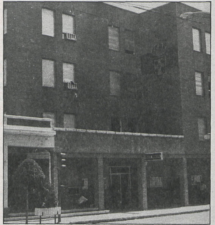
El Ayuntamiento de Boadilla dispone de un mes para contestar ante los recursos presentados por los concejales socialistas

En este mismo solar se levantará otro edificio destinado a un centro de preescolar de cuatro unidades, con una capacidad para 160 niños, por cuenta del Ayuntamiento. Por el momento se ha aprobado el proyecto y, aunque todavía no se cubrirán las necesidades, es el primer paso para la total escolarización pública de los niños de la localidad.