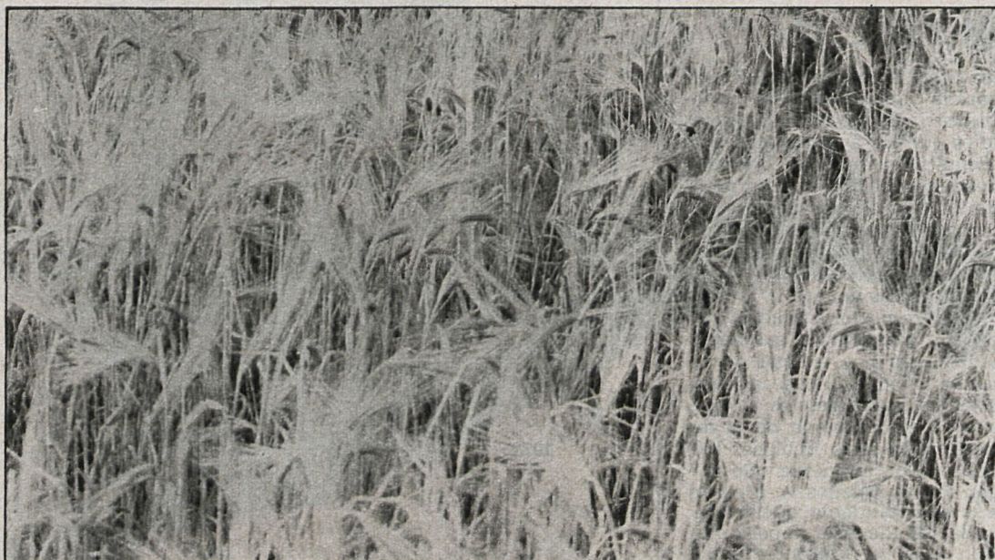
El trigo aumentó 500 hectáreas en superficie de cultivo, pasando de 42.000 de la campaña anterior a las 42.500 actuales

Para los pastos, a pesar de no haber otoñada y que el invierno, con sus heladas, fue bastante riguroso, se espera que las lluvias caídas durante estas últimas semanas consigan una recuperación para mantener la cabaña extensiva durante el mes de mayo.