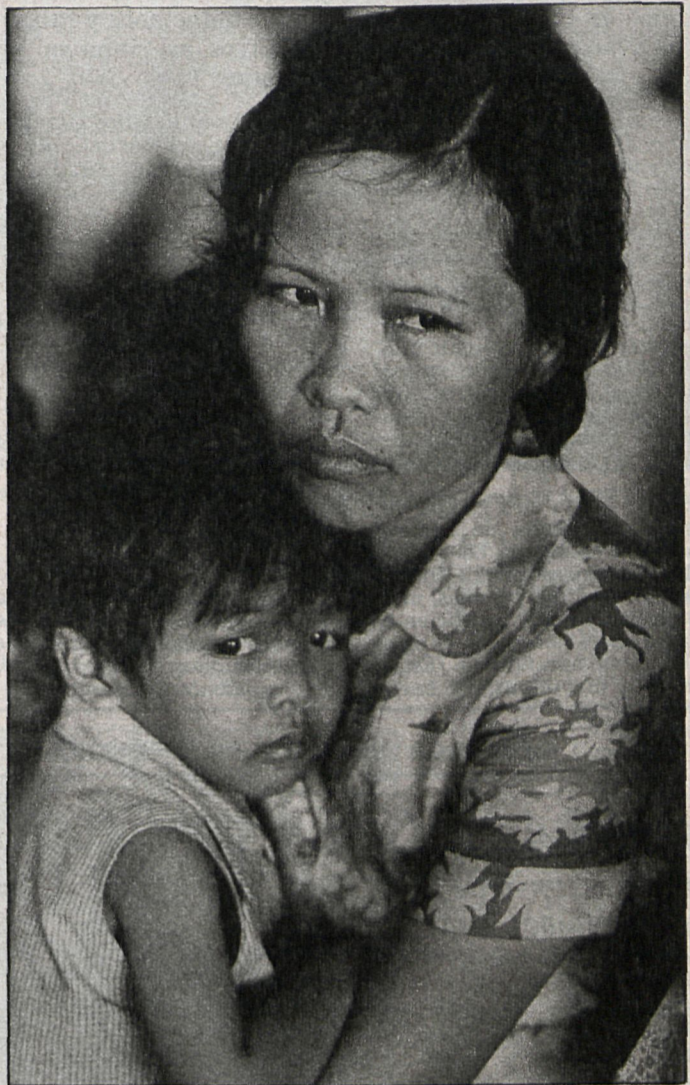
El llamado ejército de «voluntarios» puede comenzar la evacuación. La imagen triste de unas madres con temor puede desaparecer

Pekín ha denunciado con un vigor extraordinario el «aventurismo» vietnamita, que le parece teleguiado desde Moscú, y pide, sin éxito, el fin de lo que describe como una ocupación vietnamita en Camboya, mientras mantiene su apoyo al príncipe Norodom Sihanuk, el viejo y sagaz neutralista empeñado en una tarea, aparentemente imposible, de reunificar a naciona-