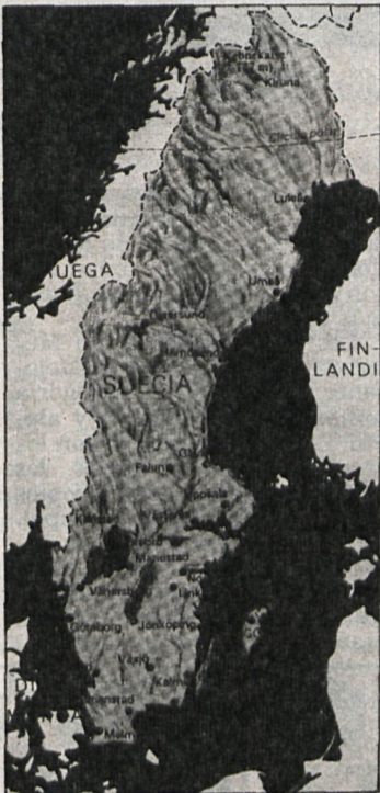
En Suecia se dedica especial atención a la enseñanza de la lengua materna de los inmigrantes

Hasta el momento, las investigaciones sobre bilingüismo se han efectuado,