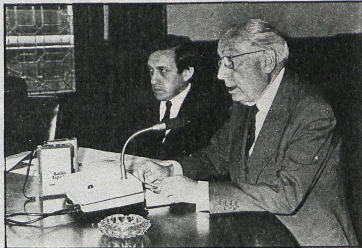
Enrique Tierno Galván, alcalde de Madrid, junto a Max Cahner, conseller de Cultura de la Generalitat, en rueda de prensa de presentación de la exposición «Catalunya en la España moderna»