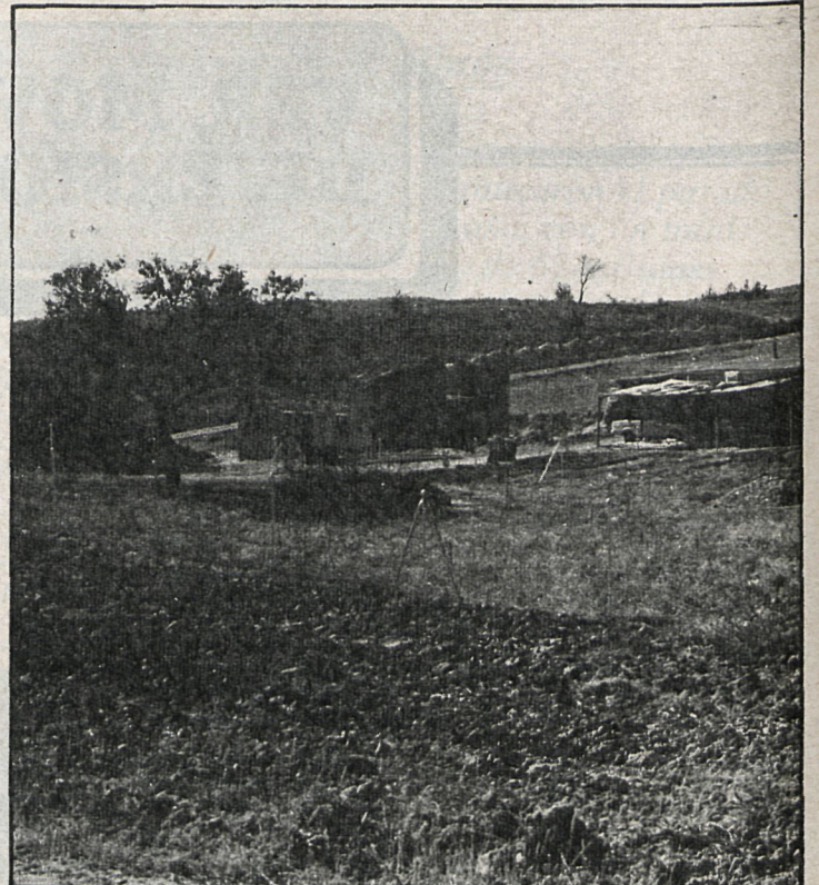
Las parcelaciones y construcciones ilegales han proliferado en la región, sobre todo durante los últimos cinco años

La Diputación de Madrid ha iniciado, en colaboración con el Gobierno Civil, la segunda campaña institucional sobre parcelaciones ilegales, cuyo objetivo es frenar este fenómeno, tan extendido en nuestra región. Actualmente existen en la provincia alrededor de 150 parcelaciones presuntamente ilegales, es decir, aquellas que, siendo rústicas o protegidas, se venden de cara a la construcción, sin contar el Área Metropolitana ni la capital. La superficie de suelo agrícola afectado es de unas 8.100 hectáreas