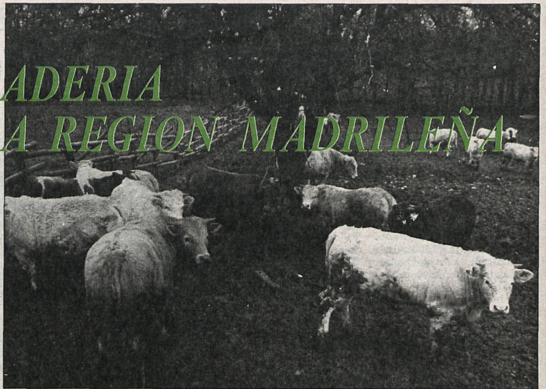
La región de Madrid tiene buenas condiciones para conseguir resultados positivos con este programa por la cantidad de pastos y recursos inutilizados que posee

La provincia de Madrid se encuentra en buenas condiciones para conseguir unos resultados positivos por la cantidad de pastos y recursos naturales infrautilizados que posee. Así, según los informes de la Dirección General de Producción Animal, donde se clasifican las zonas desfavorecidas, toda la región madrileña se califica como zona desfavorecida y con posibilidades de fomentar la ganadería extensiva. Se incluyen las seis comarcas naturales y 116 municipios, con una po-