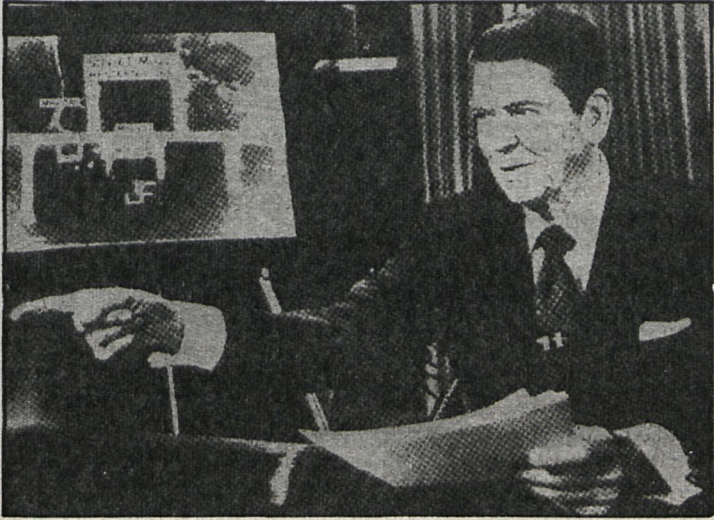
El Presidente Reagan está por la batalla