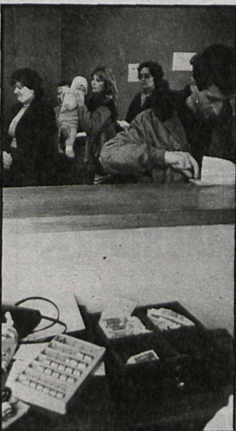
Durante los últimos años se ha hecho un importante esfuerzo para agilizar y hacer más eficaz el sistema recaudatorio

La Diputación de Madrid tomó la iniciativa, en 1980, de apoyar al Ministerio de Hacienda para censar esas viviendas. Para esta labor se creó, a instancias del diputado socialista José Borrell, el Programa de Promoción de la Capacidad Recaudatoria, que en los dos últimos años ha censado, en quince municipios, unas 200.000 viviendas. Las dificultades con que tropieza la gestión de este programa tuvieron claro exponente hace unos meses cuando se produjo en Boadilla del Monte una negativa, por parte de los propietarios de varias urbanizaciones, a que los equipos técnicos de la Diputación midieran sus fincas, algunas de las cuales carecían de licencia de obras y, en su mayoría, las edificaciones construidas no coincidían con los proyectos, existiendo más metros construidos que proyectados. Se da el caso de que estos chalés pertenecen a personas (cantantes, políticos)