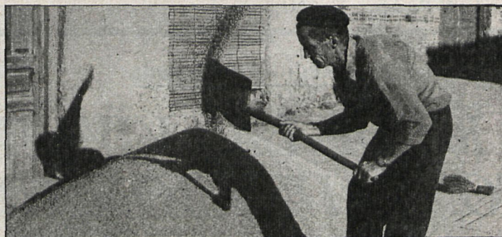
La reducción del seguro combinado de incendio y pedrisco para cereales de invierno beneficiará a los agricultores madrileños por ser el seguro de más implantación

Todas estas medidas vienen por la voluntad del Gobierno, a través de la Entidad Nacional de Seguros Agrarios (ENESA), de hacer los seguros accesibles a los medianos agricultores y llegar con el tiempo a asegurar las cosechas, para no