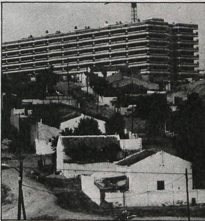
La reducción de presupuestos puede suponer que las viviendas de promoción pública ya construidas no puedan ser habitadas por las familias residentes en casas bajas, a las que iban destinadas

Sin embargo, la reducción de presupuestos puede suponer, según los afectados de Palomeras-Vallecas, que las 5.311