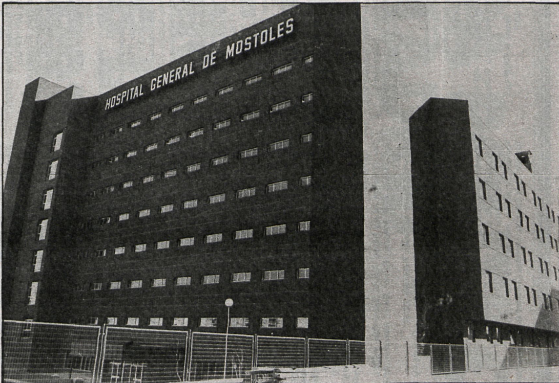
Desde que se inició su construcción en 1978, los vecinos de Móstoles han esperado pacientemente la apertura del Hospital para que solucione los problemas sanitarios

El hospital ha sido abierto parcialmente dentro del planteamiento inicial de efectuar una apertura gradual en tres fases, «aunque hubiéramos tenido la dotación completa de material, no abríamos abierto al público la totalidad de los servicios, es mejor hacerlo gradualmente, saber qué tenemos y hasta dónde queremos», nos decía D'Ocasar. En la primera fase se atiende a los pacientes que requieran asistencia en los siguientes servicios: medicina interna, cirugía, traumatología y pediatría, todo ello con sus correspondientes servicios de apoyo, es decir, hematología, banco de sangre, rayos, laboratorio, anestesia, rehabilitación, cuidados intensivos, etc. Asimismo están a disposición de estos servicios 154 camas de las 408 con que cuenta el centro hospitalario.