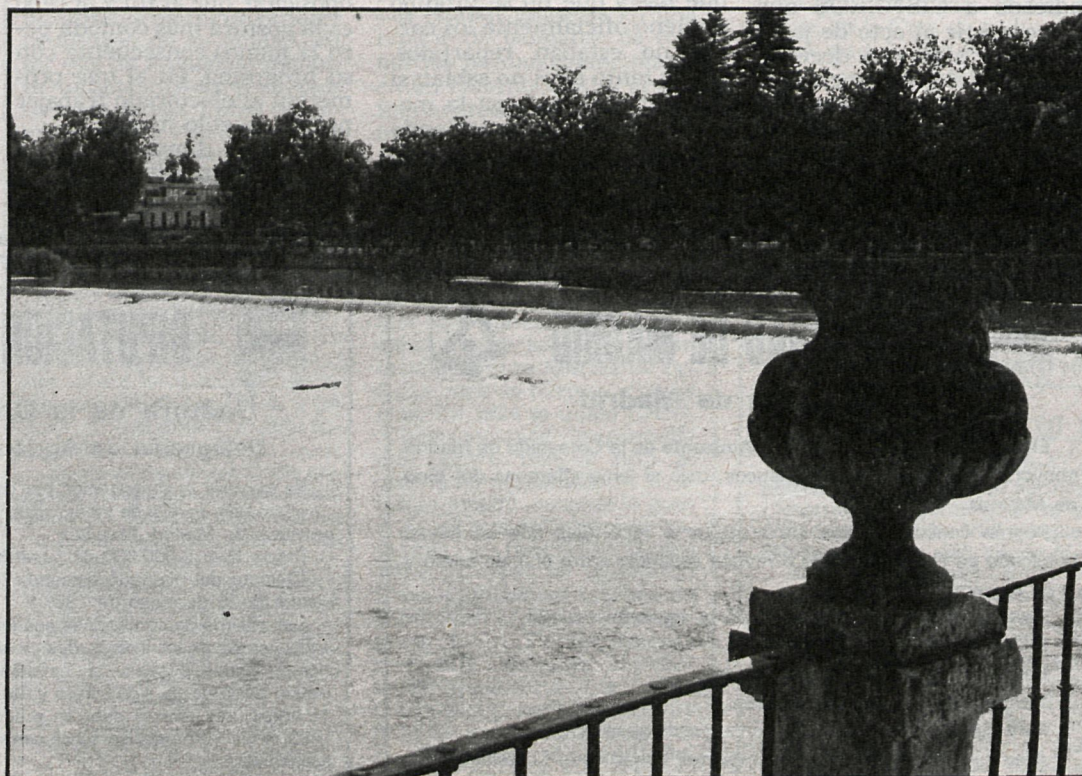
El Ayuntamiento de Aranjuez dictará un bando recomendando a los vecinos que no se bañen en el río

No obstante, el mayor problema del Tajo a su paso por Aranjuez es el problema que vive toda la vega y que se cifra, fundamentalmente, en la pertinaz sequía. El trasvase de aguas del Tajo al Segura, cifrado en su límite máximo en 25 millones de metros cúbicos en tiempos excedentarios, origina un nuevo problema cuando el excedente se convierte en carencia, y esta situación se ha convertido actualmente en un nuevo elemento de protesta.