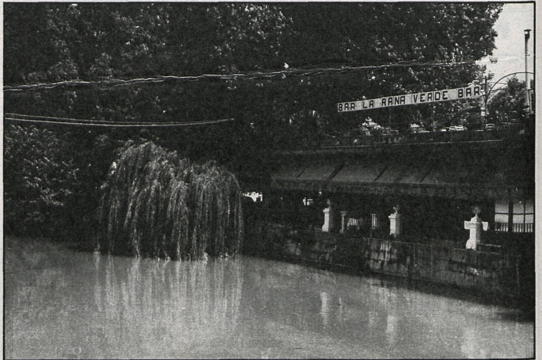
Los vertidos contaminantes están afectando gravemente al río Tajo

Ante esta situación, que otros pueblos de la provincia vienen calificando desde hace tiempo como de «altamente preocupante», el Ayuntamiento de Aranjuez ha acordado por unanimidad el poner en marcha una serie de medidas encaminadas a paliar la situación, y no se descarta una petición formal al Ministerio de