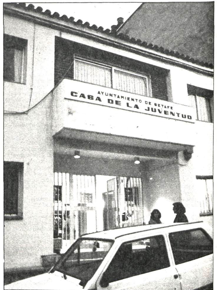
El nuevo servicio está ubicado en la Casa de la Juventud

Como ya informamos hace varios números, el objetivo de este centro es orientar a los jóvenes sobre todos aquellos aspectos que influyen en mayor medida en su vida.