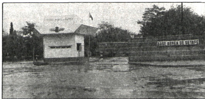
En el museo se expondrán algunos de los aviones que habitualmente utilizan la base aérea de Getafe

El programa de este intercambio, recoge algunas visitas a museos y ciudades con especial atractivo histórico como Segovia y Toledo, pero se centra principalmente en el intento de darles a conocer aspectos curiosos de los lugares que visiten y, sobre todo, modos y costumbres propias.