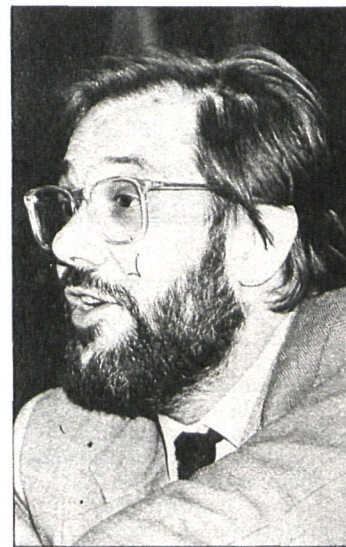
Javier Solana, ministro de Cultura

El pasado viernes, desde el balcón del Ayuntamiento de Torrejón, el ministro de Cultura y Deportes, Javier Solana, dio comienzo oficialmente a las fiestas de la localidad como pregonero de las mismas. El señor Solana se dirigió a los vecinos que ocupaban la Plaza Mayor y señaló el carácter cultural de las fiestas populares. Prosiguió su intervención realizando y reivindicando las fiestas de los pueblos y ciudades como hechos culturales en sí mismos, y deseó a los vecinos de Torrejón de Ardoz que aprovecharan los actos festivos para estrechar lazos de amistad y mejorar la convivencia diaria en un ambiente de paz y alegría.