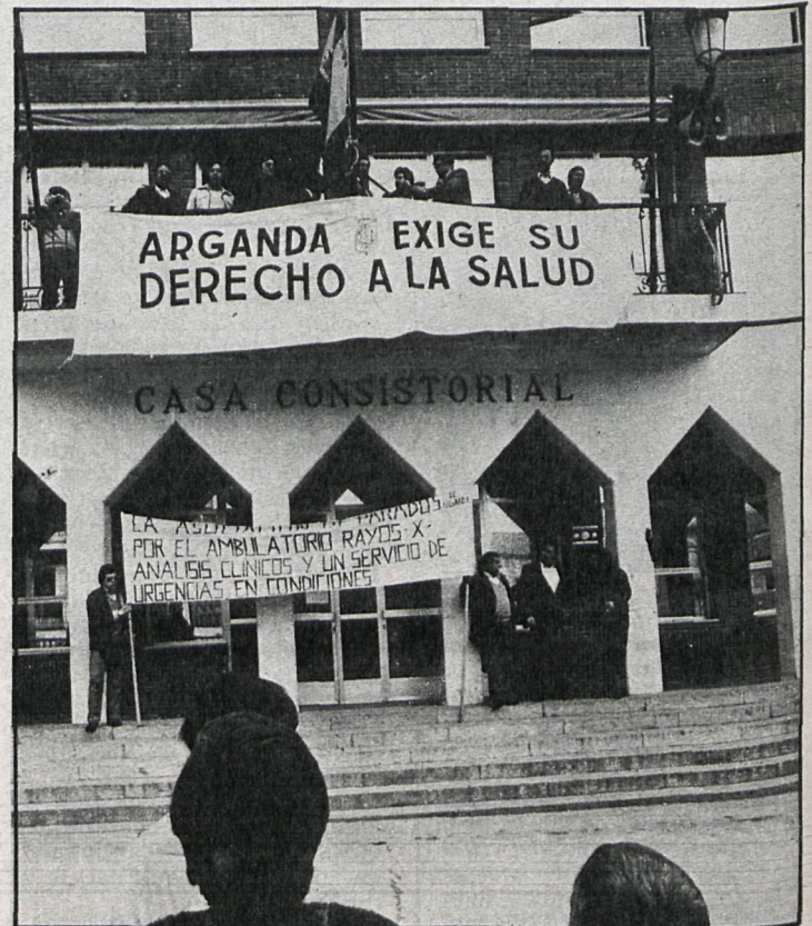
Las movilizaciones populares que impulsaron las obras de ampliación del ambulatorio de Arganda podrían repetirse para solicitar que sean terminadas

Tras esta entrevista ha quedado completamente desestimada la construcción de un consultorio en La Poveda, barrio perteneciente a Arganda, situado en uno de los extremos del municipio y considerablemente separado del núcleo urbano. Este consultorio también estaba recogido en el Plan de