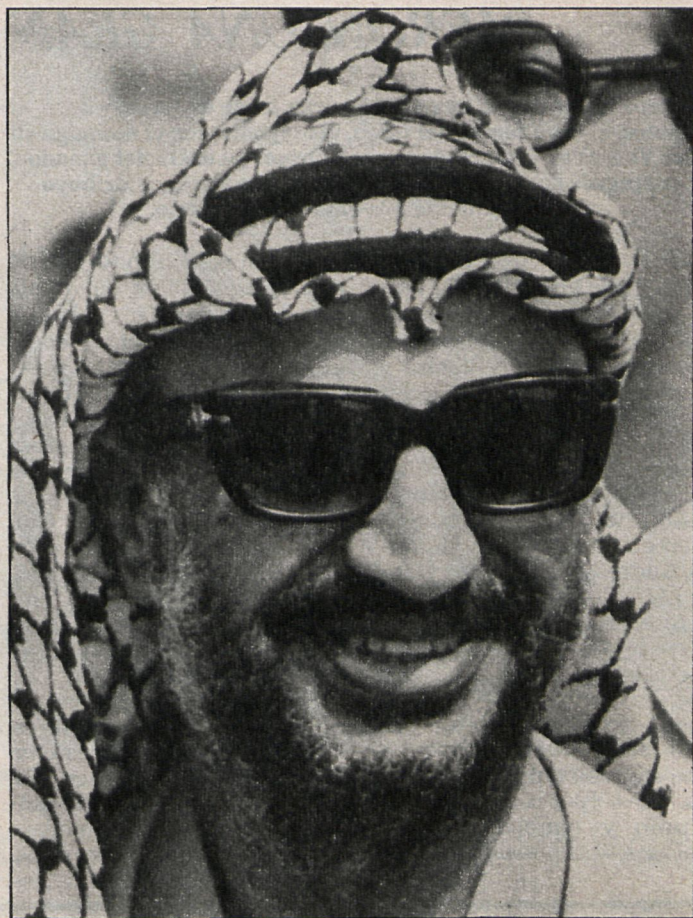
Yasser Arafat, frente a la resistencia palestina, está atravesando uno de los peores momentos de su historia política

Abu Amar fue un «hermano musulmán» (radical nacionalista de derecha) en su juventud. Es ingeniero de formación, nació en Jerusalén y se forjó profesional y políticamente en El Cairo. Formó parte, como la mayoría de los dirigentes de la OLP, del Movimiento Nacionalista Árabe, que, después de la segunda guerra mundial y en el marco de la feroz lucha anticolonial, actuó como un semillero de líderes políticos, estudiantiles y sindicales. Su