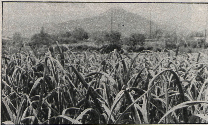
La escasez de agua ha mermado considerablemente las cosechas en nuestra región

La falta de agua está incidiendo ahora más en los cultivos de regadío. Así se ha perdido la patata en la zona de Arganda. La experiencia desarrollada por la extinta Diputación sobre plantas aromáticas, cultivo que ofrece po-