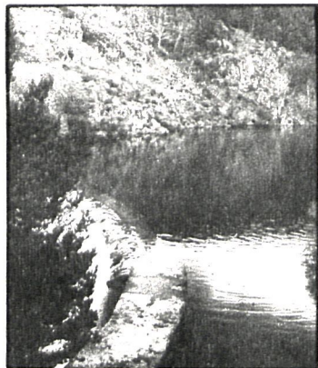
Presa del Pradillo, límite entre el Angostura y el Lozoya

Es indudable que en Angostura la calidad fluvial se perpetúa por unas condiciones hidrobiológicas peculiares: la ausencia de elementos contaminantes, la imposibilidad de la acampada libre (salvo en zonas concretas) y la estrecha vigilancia mantenida en sus márgenes aseguran una continuidad permanente. El único borrón lo ponen ciertos visitantes, poco escrupulosos, que en verano, y gracias a la accesibilidad que proporciona la carretera que une el valle del Lozoya con los puertos, siembran la zona de desperdicios, obviando las papeleras instaladas por Icona.