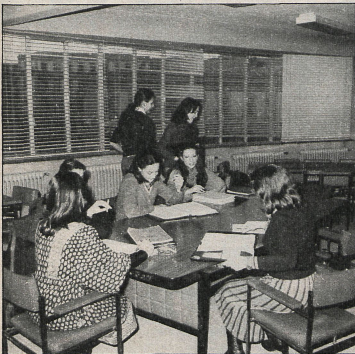
Mil trescientos cincuenta y tres universitarios podrán estudiar en Alemania