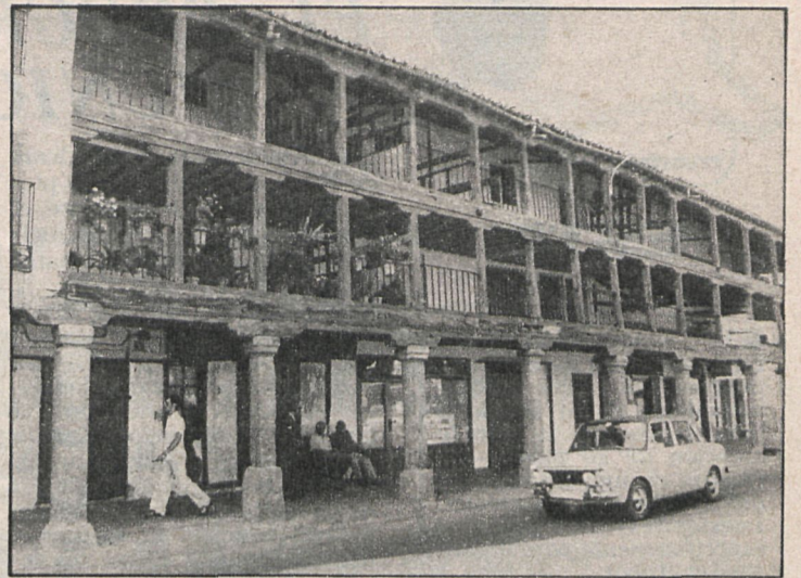
La Corporación de Navalcarnero pretende conseguir la plena escolarización en el municipio

En la misma reunión plenaria acordaron solicitar al MOPU la cesión, en precario, del terreno de su propiedad ubicado entre las calle Palencia y la ronda de San Juan para instala-