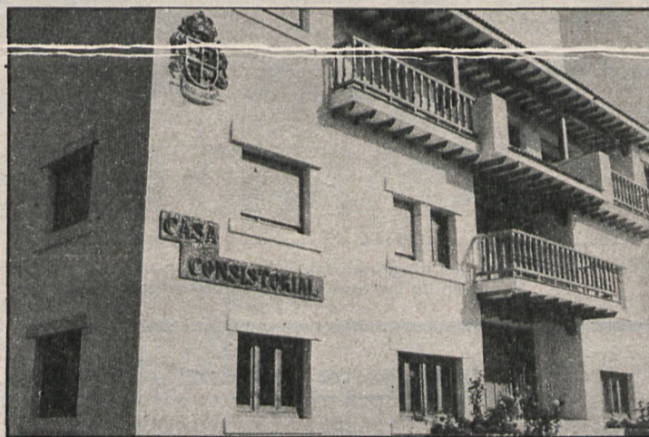
En los locales del Ayuntamiento de Arroyomolinos se pasa actualmente la consulta médica

La distribución del presupuesto en el capítulo de ingresos es la siguiente: 1.127.219 pesetas por impuestos directos; 141.280 por los indirectos; 4.633.050 en concepto de tasas y otros ingresos; 945.000 pesetas por enajenación de inversiones reales, y cinco millones por la variación del pasivo financiero, lo que supone la composición principal de los ingresos que recaudó el Ayun-