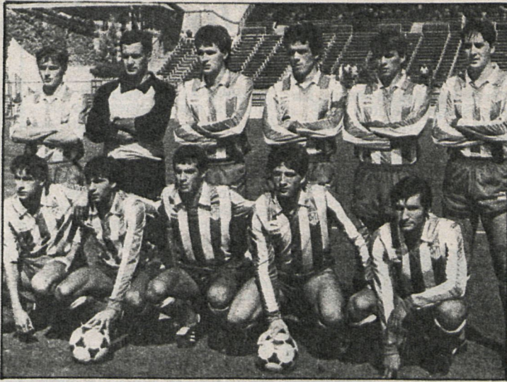
El Atlético Madrileño, que anda muy fuerte en estos momentos, tendrá que seguir demostrándolo en su salida al campo del Rayo Vallecano

Pegaso-Manchego. — Difícil enemigo les ha tocado a «los camioneros»; fuertes y expertos, en disposición de puntuar con frecuencia. Los he visto ya jugar en dos ocasiones esta