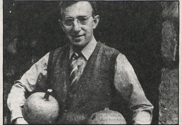
«Zelig»: un protagonista para una buena película