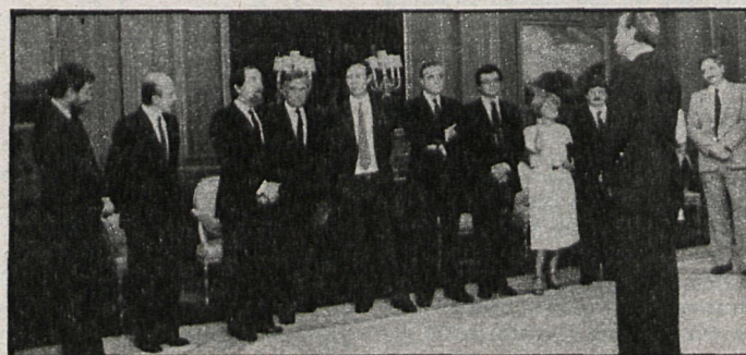
El Rey don Juan Carlos recibió en su despacho a los responsables de LIBER-83, I Salón Internacional del Libro que se celebra en España

Por último, el Salón cuenta con un área dedicada exclusivamente a las NUEVAS TECNOLOGIAS aplicadas a la esfera editorial: sistemas integrados de tratamiento de texto e imagen, bases de datos especializadas, videotex y teletex.