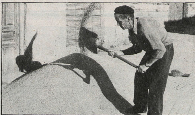
Para poder solicitar préstamos para semillas en la campaña vigente es preciso haber cumplimentado el seguro integral

En cebada, 2.200 kilos/hectárea para la comarca de la Campiña y la menor producción regional en la comarca de la sierra norte, Lozoya-Somosierra, con 1.600 kilos/hectárea. En los restantes cultivos se establece 1.400 kilos/hectárea para avena y 1.300 kilos/hectárea para centeno. El único siniestro que atiene este seguro es la disminución de los rendimientos por debajo de los fi-