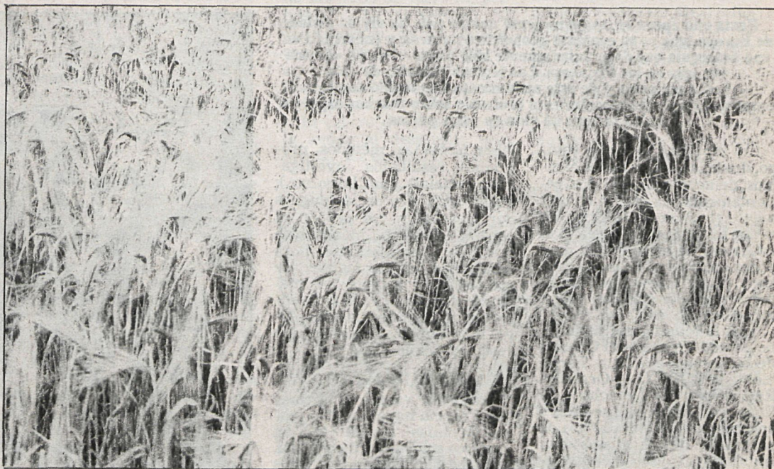
La cosecha de cereales ha estado por debajo de la media, y en muchos pueblos los agricultores no han sacado ni para cubrir gastos, con pérdidas cuantiosas durante tres años consecutivos

Además, una de las condiciones para poder acceder a las moratorias en los préstamos de fertilizantes solicitados al SENPA era que durante los tres últimos años hubieran sido afectadas las mismas explotaciones. Con esto han sido muchos los agricultores que se han visto imposibilitados para