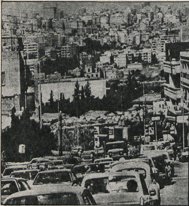
El Líbano, a simple vista, parece un país pacífico y sin problemas