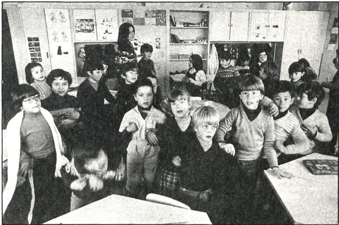
Sistemas, métodos, programas, resultados, reciclaje, todo un programa para la enseñanza de nuestros jóvenes

Tampoco vamos a afirmar que Francia haya tenido o tenga fórmulas magistrales, ni tampoco soluciones ideales; no, nada hay definitivo y menos aún en pedagogía. Simplemente pensamos que ha afrontado cada situación histórica y que se han tomado decisiones. El lector juzgará, según su particular criterio.