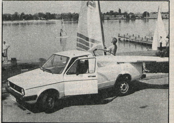
Más de 77 millones de marcos ha destinado la R. F. A. a la ayuda del desarrollo. La industria automovilística, por ejemplo, es la tercera del mundo

lo constituye la formación y especialización de personal cualificado y directivo en los mismos países en desarrollo. Naturalmente, la ayuda de los estados federados se realiza siempre en coordinación con el Gobierno central de Bonn, ya que la cooperación en el sector del desarrollo con los países del tercer mundo es de la competencia del Estado federal (Dad).