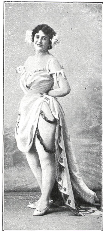
TARJETA POSTAL (Srta. Pablo)

Otro motivo de éxito ha sabido conquistarse la empresa de Eslava po-