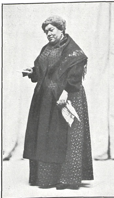
REMIGIA (Srta. Alba)

Romea y Santiago, es decir, el tío Jacinto y Felipe , parecían dos baturros arrancados de Aragón para traerlos al teatro Lara. Al público le parecieron dos