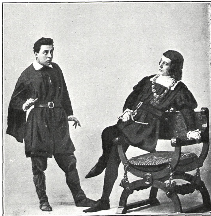
EL COMEDIANTE (Sr. Cerro)

De ahí el drama dentro del drama; de ahí los escrúpulos que le asaltan cuando, estando el rey en oración, se le presenta ocasión de matarle; de ahí que sus vacilaciones en tomar por el atajo para no cometer un crimen al ejecutar un acto que le es repulsivo, da lugar á que frustren sus planes imprevistos sucesos: de