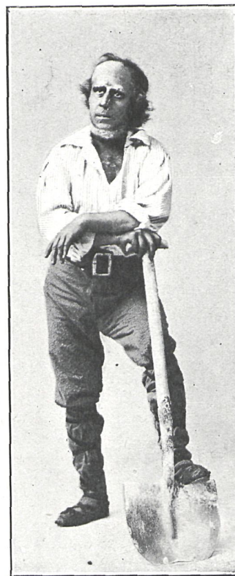
SEPUTURERO (Sr. Juárez)

ma combinación de cualidades selectas» de el rey que, como Hamlet, quiere dirigir los acontecimientos y que para ello le alienta el buen éxito de sus anteriores crímenes, de Polonio, que es un viejo insensato y vacío que tiene igual pretensión, de la reina que es solo cómplice y de todos los personajes en conjunto que, por particulares móviles, trabajan de consuno para que se realice la catástrofe final que, según frase de uno de ellos, ha de convertir la escena en un campo de batalla.