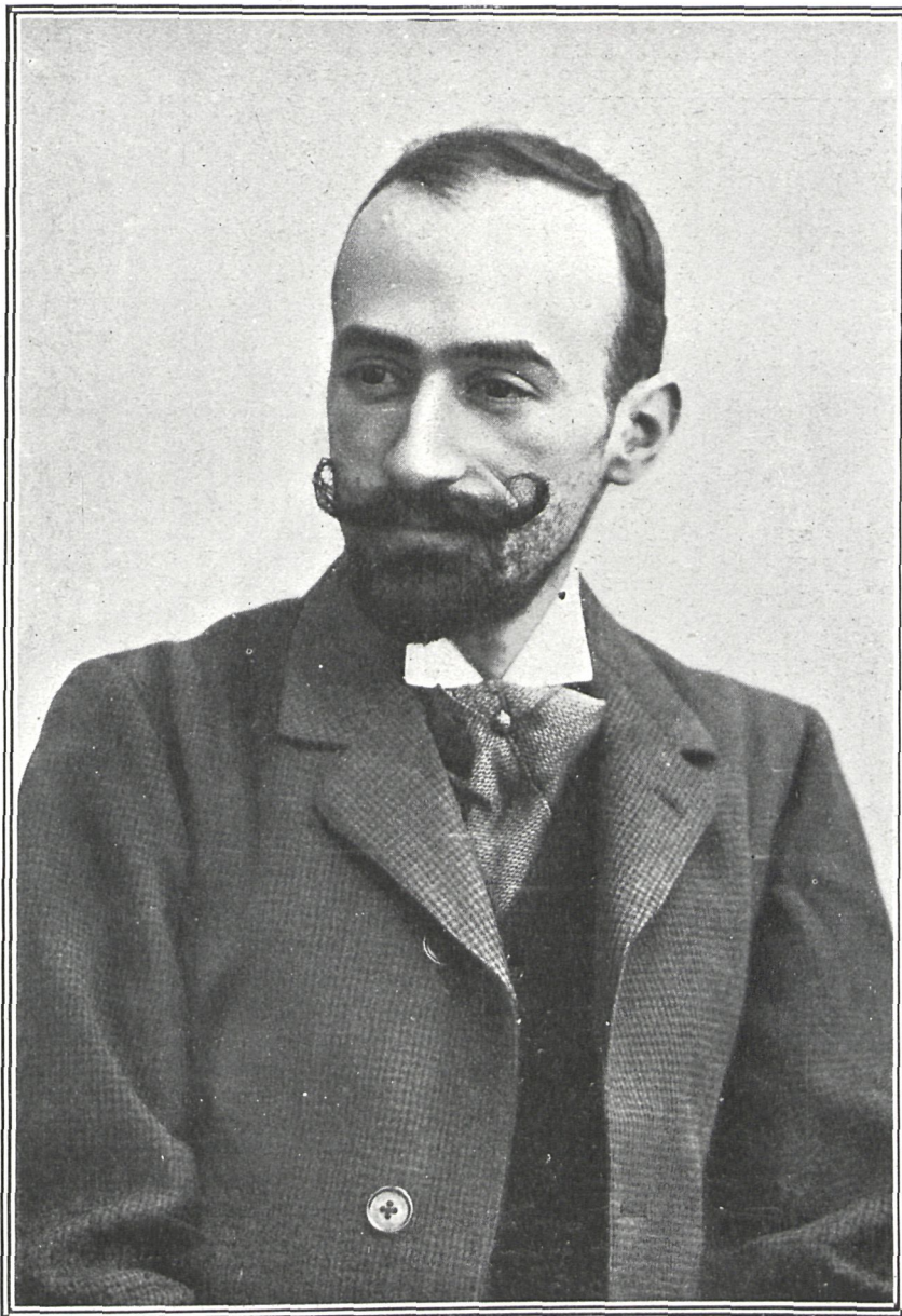
D. JACINTO BENAVENTE, AUTOR DE «EL HOMBRECITO»

En la serré toman té, hablan y tocan el piano muy animadas Nené, Pepita, Casilda, María Teresa y Beatriz. Poco después de alzarse el telón entran en el gabi-