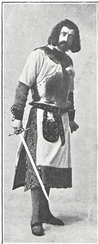
LAERTE (Sr. Alens-Perkins)