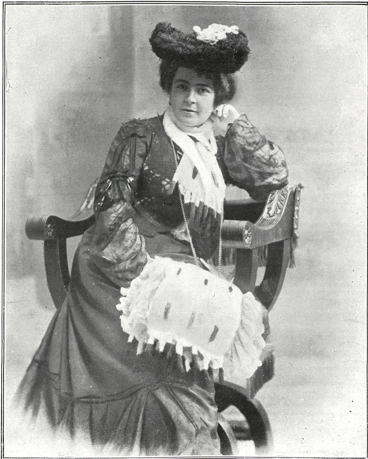
EMMA CARELLI, TIPLE DRAMÁTICA DEL TEATRO REAL (Fot. Guigoni Bossi)