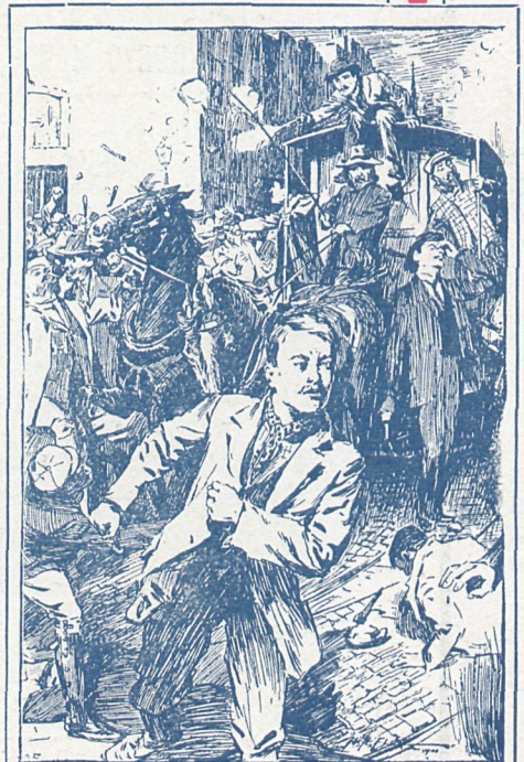
OS AGENTES VENCIERON Á TIROS LA OPOSICIÓN DE LOS RUELOUJISTAS

Los pedidos á NUEVO MUNDO, Santa Engracia, 57. Madrid