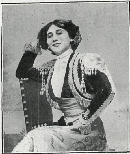
GRACIA LA MORENITA