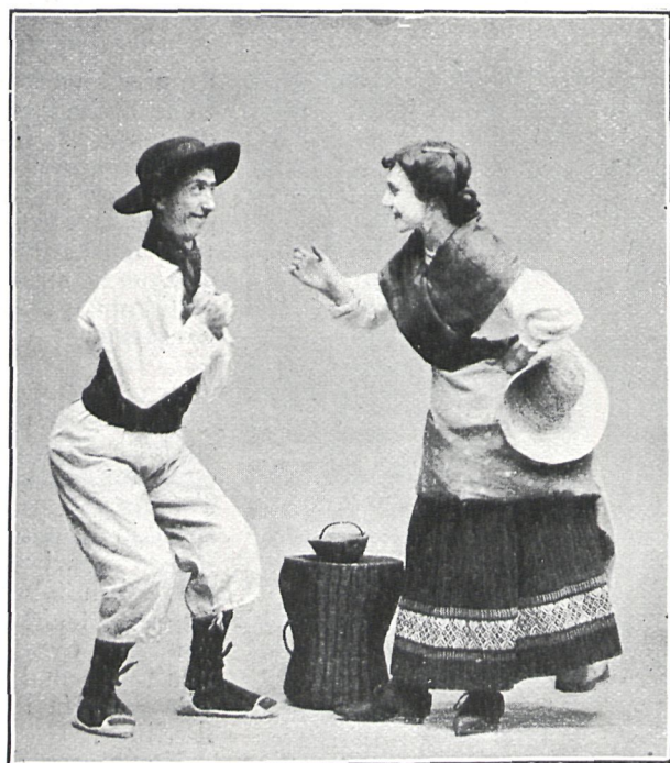
CUTUCHÉ Sr. Vera

Así lo manifiesta al joven Custodio cuando éste le pide la mano de su sobrina, asegurando que el padre, al morir, dejó escrita su voluntad de que Camino permaneciera soltera hasta los veintiún años.