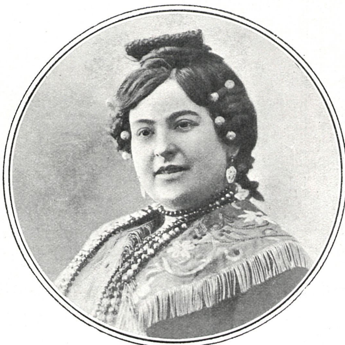
EN «LA MANTA ZAMORANA»

Sus condiciones artísticas, su figura graciosa y elegante y la belleza de su rostro, hicieronla simpática desde el primer momento, y su voz agradable y bien timbrada de que le permitía hacer alarde la excelente educación musical que había recibido de un