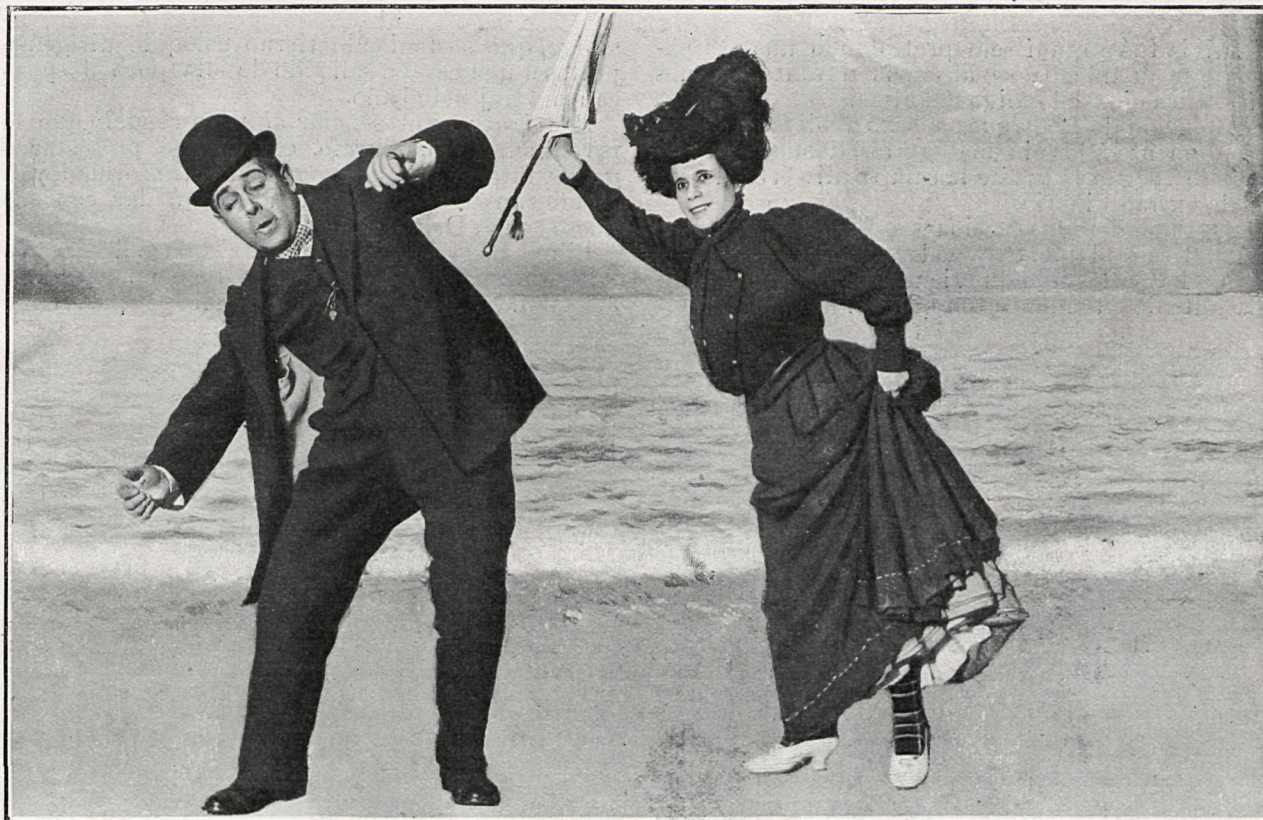
ENRIQUE CHICOTE V LORETO PRADO EN LA CINTA CINEMATOGRAFICA