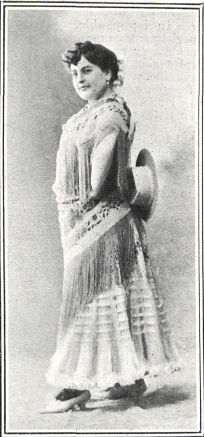
EN «VENUS SALON»