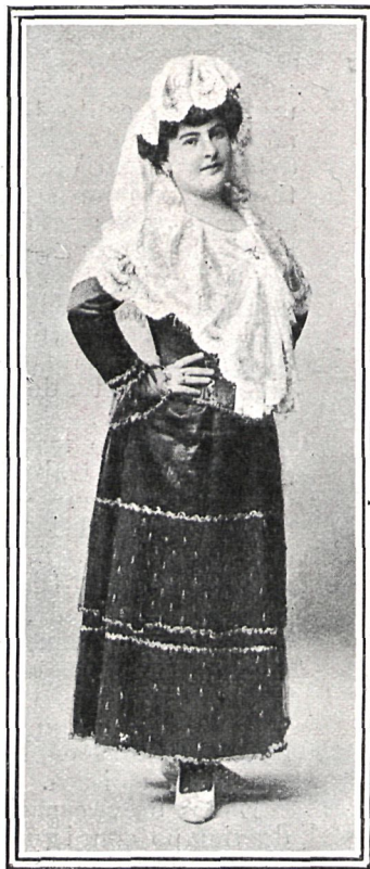
EN «GÉNERO INFIMO»

Los tipos populares son su especialidad, no solamente por el acierto con que los caracteriza, sino también por la gracia pícarca con que los interpreta. Esto no quiere decir que á su cuerpo elegante y á su rostro de sugestiva belleza no sienten bien los trajes femeninos más lujosos. Antes al contrario, posee la facultad tan apreciable en una artista, de interpretar con idéntica perfección los tipos más opuestos, imprimiéndole á cada uno el aire que le es propio.