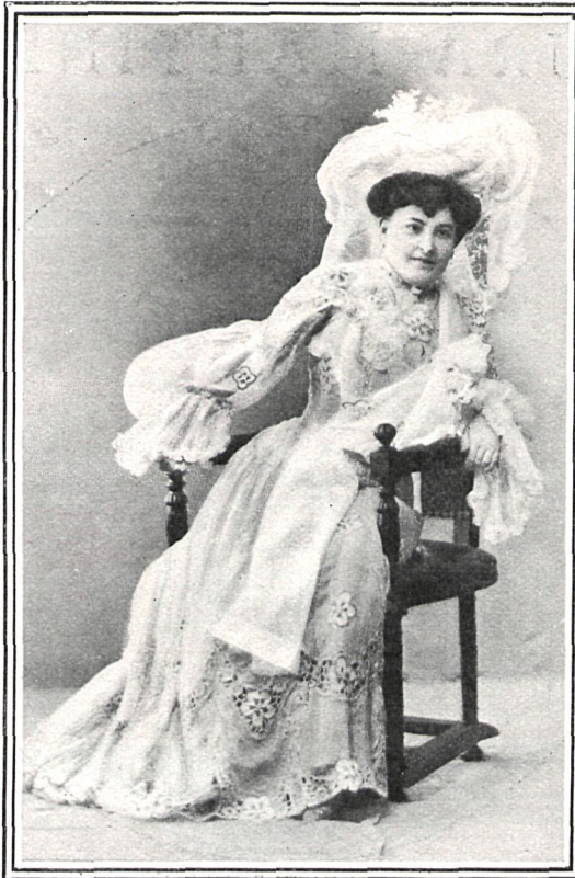
EN «SAN JUAN DE LUZ»