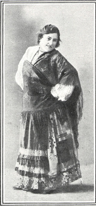
EN «EL PUÑO DE ROSAS»