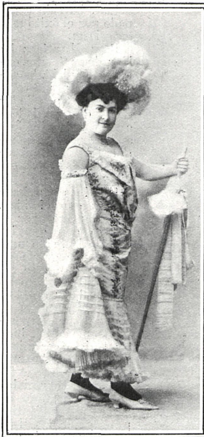
EN «VENUS SALON»