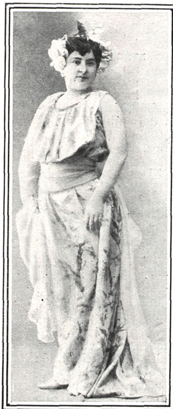
EN «EL PREMIO DE HONOR»