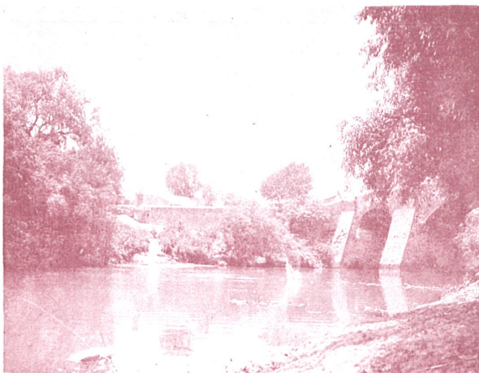
MÉXICO: PUENTE SOBRE EL RÍO DE JULA (ESTADO DE HIDALGO) Inst. de González Guerra.