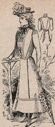
Traje para señorita de 10 á 14 años.