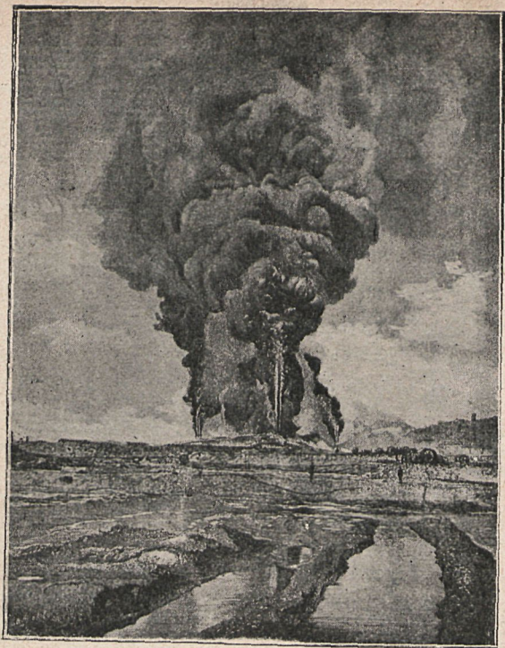
RUSIA: Incendio de tres pozos de petróleo en la Región de Bibi Eytat.