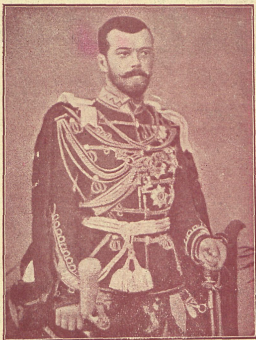
Emperador Nicolás, Czar de Rusia.