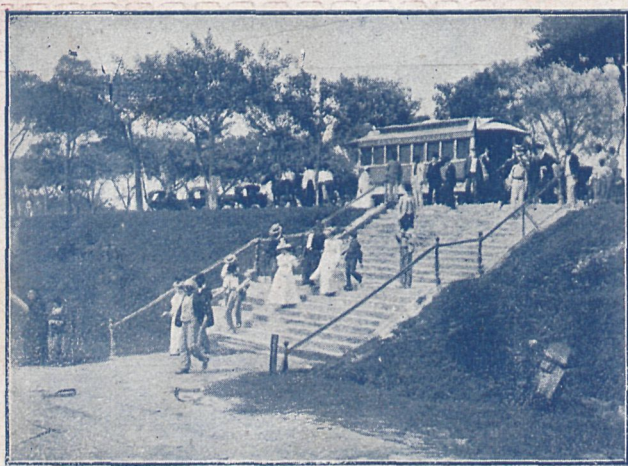
HABANA.—Trenvía de Marianao