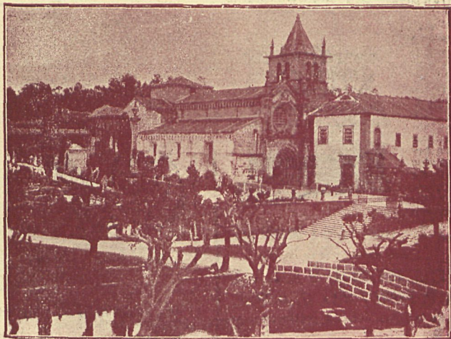
PORTUGAL, — Monasterio de Poço de Souza Fundado en 960 de J. C.