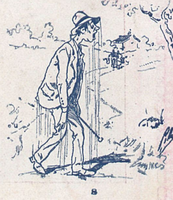
Dibujo de Cilla.