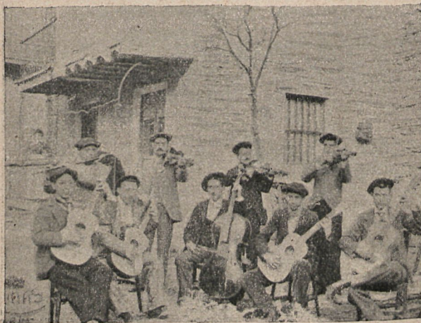
La Unión Tudelana.