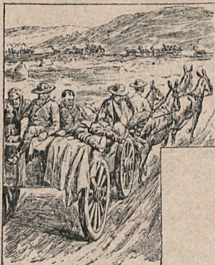
Convoy de heridos boers.