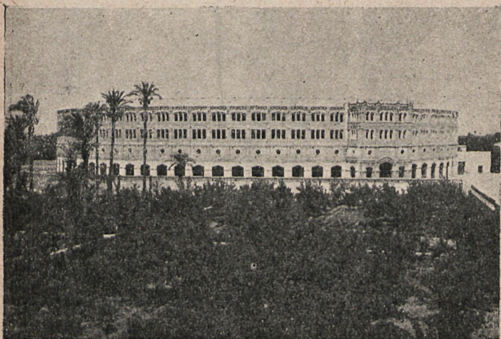
La Plaza de Toros.