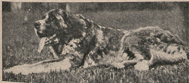
Princesa. Valor: 10.000 dollars.