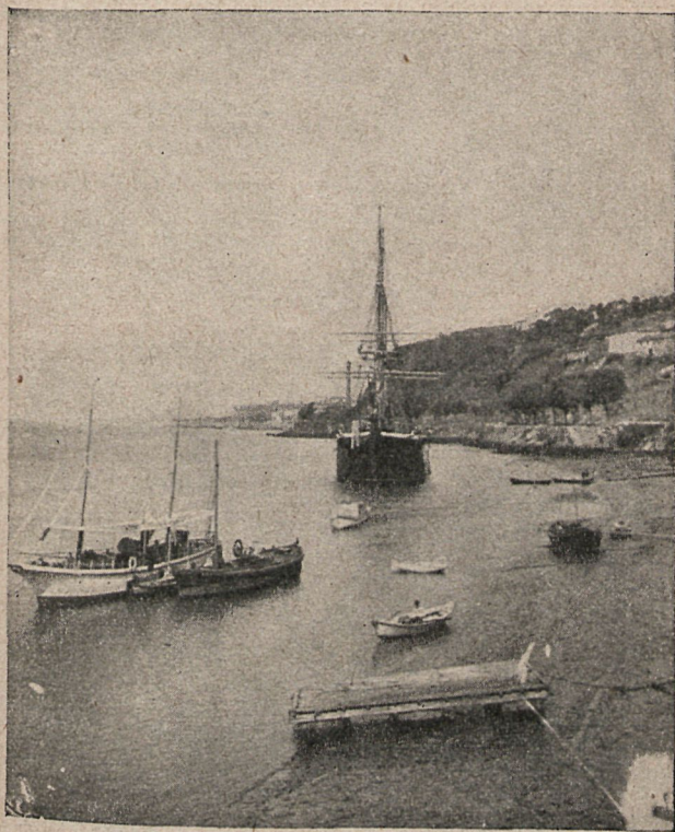
Corbeta escuela de guardias marinas en el río Douro.