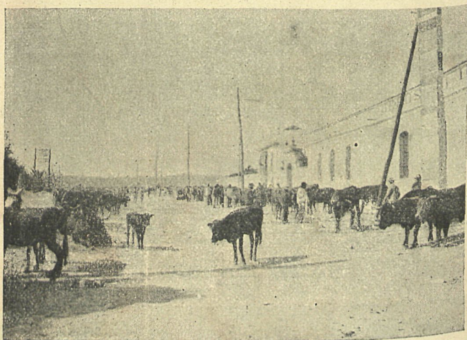
Instant. de Huerta Stern.