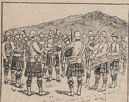
La música en la batalla de Maggersfontein.