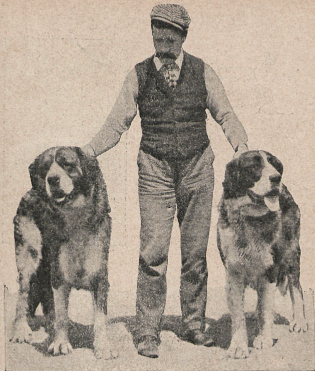
Marblecroft y Princesa. Valor: 15.000 dollars.

fabulosos, y sólo explicables teniendo en cuenta que se trata del país de los yanqui, donde todo lo raro y caprichoso es moneda corriente.