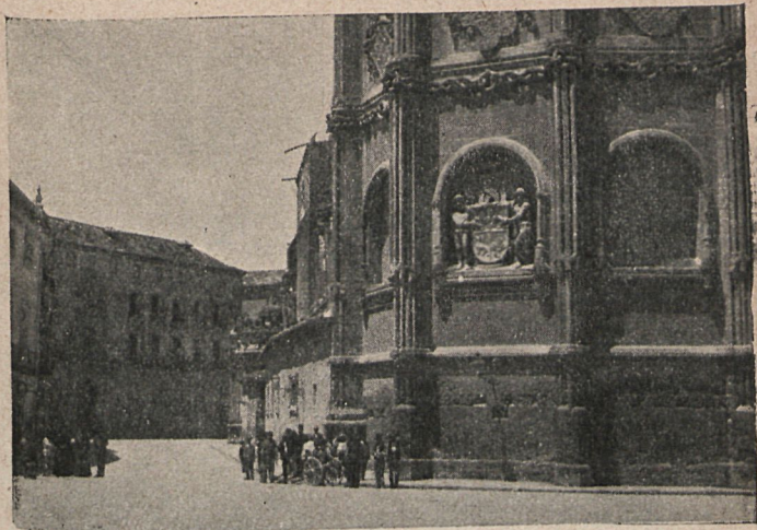
Exterior de la capilla del Marqués de Vélez.