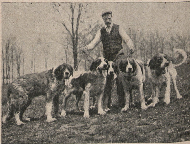
Princesa, Chantrel Kitty, Hornsea Countess, Helenell y Marblecroft. Todos juntos: 24 600 dollars.

Como consecuencia de este nuevo sport ha venido un aumento extraordinario del coste de aquellos animales, y alguno de ellos han alcanzado precios verdaderamente