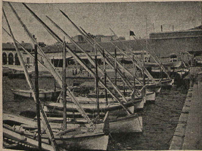
CARTAGENA.—El embarcadero. Inst. de M. Dorda y Mesa.