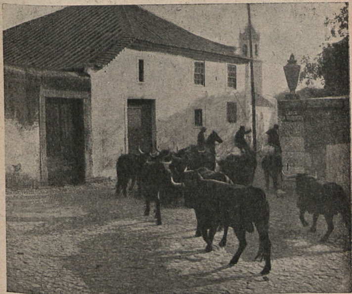
Inst. de Raoul Pires.