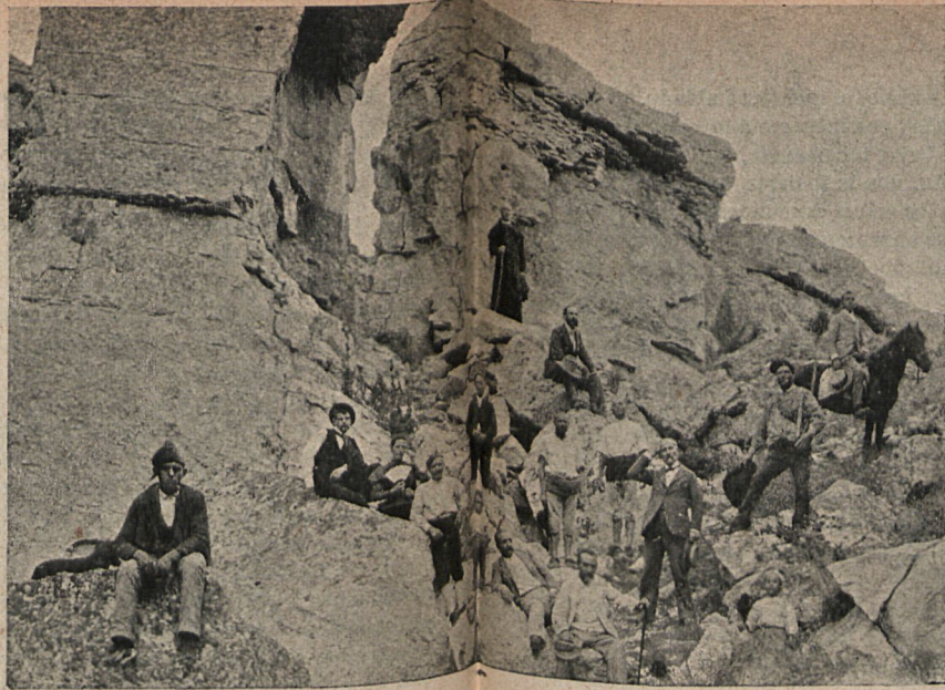
TERUEL.—Barranco de la sima de San Pedro entre Ariño y Oliete.

El señor Crousoé, como ustedes saben, abandona su hogar, provisto de respetable cantidad de cuentas de vidrio, con el laudable fin de engatusar