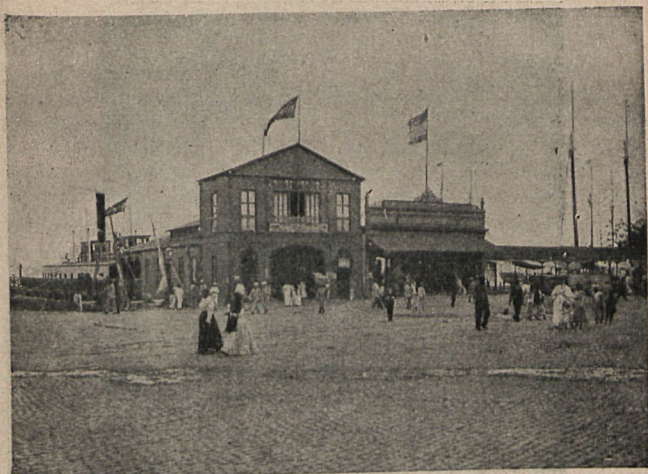
Inst. de S. Rodríguez Valdés.