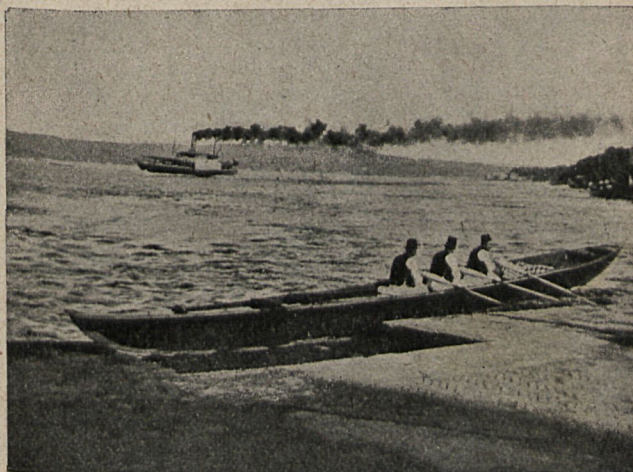
En las costas de Turquía.

¿Se asombran ustedes? ¿No comprenden qué relación pueda existir en-