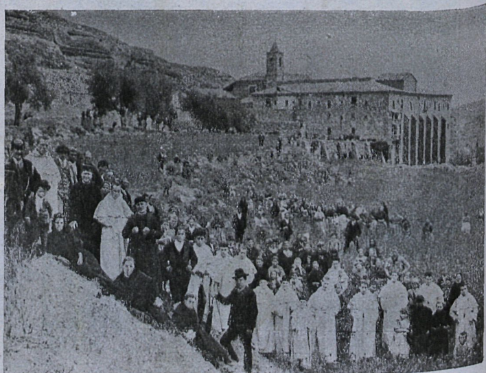
Inst. de Garate.