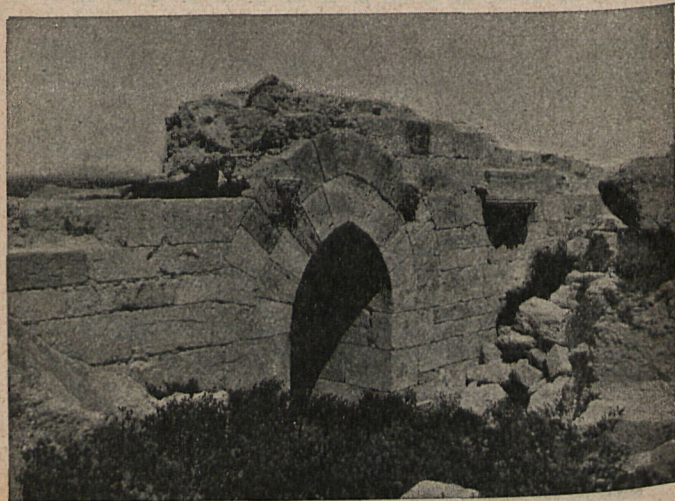
CARTAGENA.—Ruinas del castillo de la Concepción. Inst. de M. Dorda y Mesa.