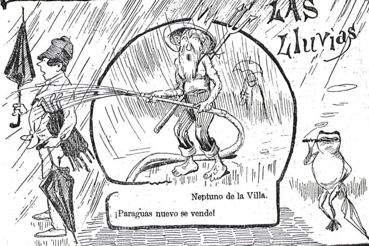
Neptuno de la Villa.