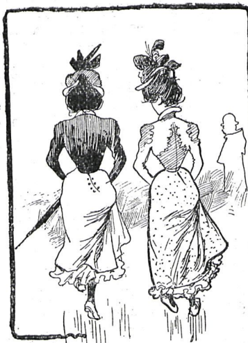
Estoy por subirme más los bajos.