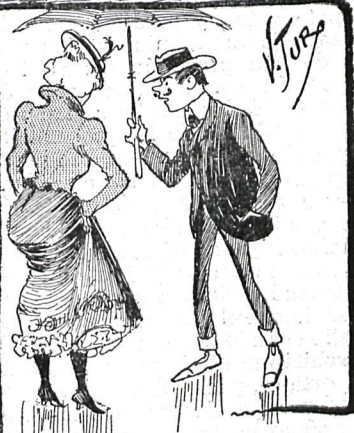
¿....? ¡A buena hora! Ya estoy toda mojada.