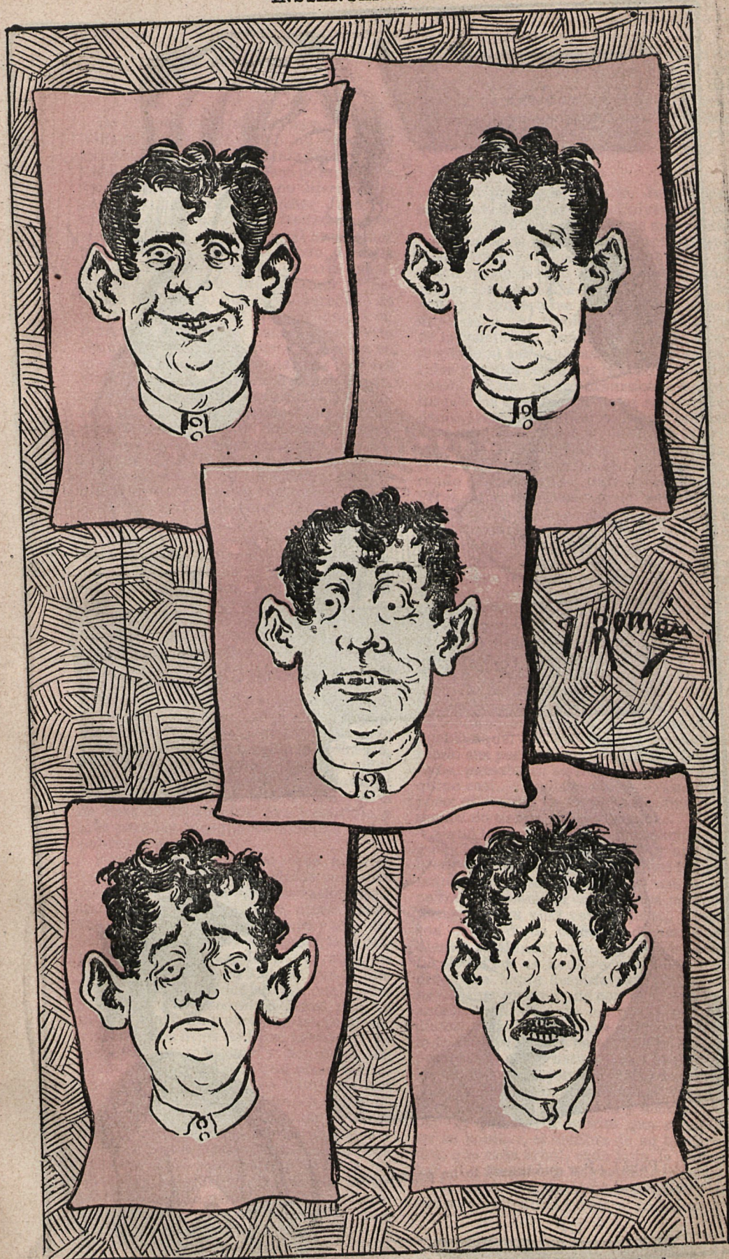
Transformaciones de la cara del Chaqueta , novillero de entretiempo, desde la salida de la cuadrilla hasta la hora de la muerte..... amén Jesús..