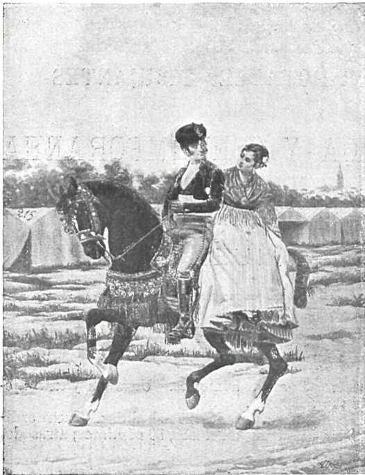
Inst. de A. Beauchy.