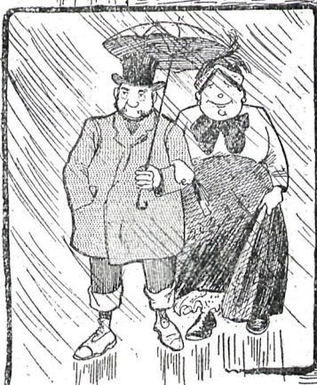
Chico, apenas me cubres con tu paraguas, ya me estoy poniendo hecha una sopa.