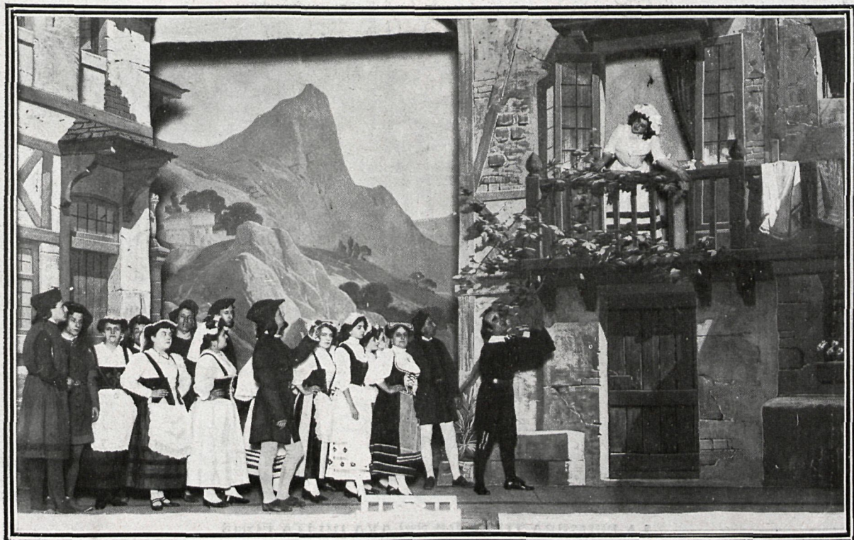
ESCENA FINAL DE LA OBRA

Por las fotografías que publicamos se ve que la mise en scene ha sido excelente, y que el bailable resulta muy vistoso.