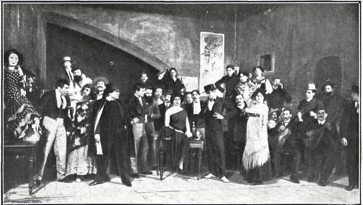
PARÍS. THÉÂTRE DES ARTS. UNA ESCENA DEL PRIMER ACTO DE LA MARQUESA, OBRA DE COSTUMBRES ESPAÑOLAS, RECIENTEMENTE ESTRENADA

El Theatre des Arts, de París, no persigue el lucro ni mucho menos; procura dar variedad constante al cartel, en el cual figuran obras de autores nacionales y extranjeros alternando con obras de autores franceses.