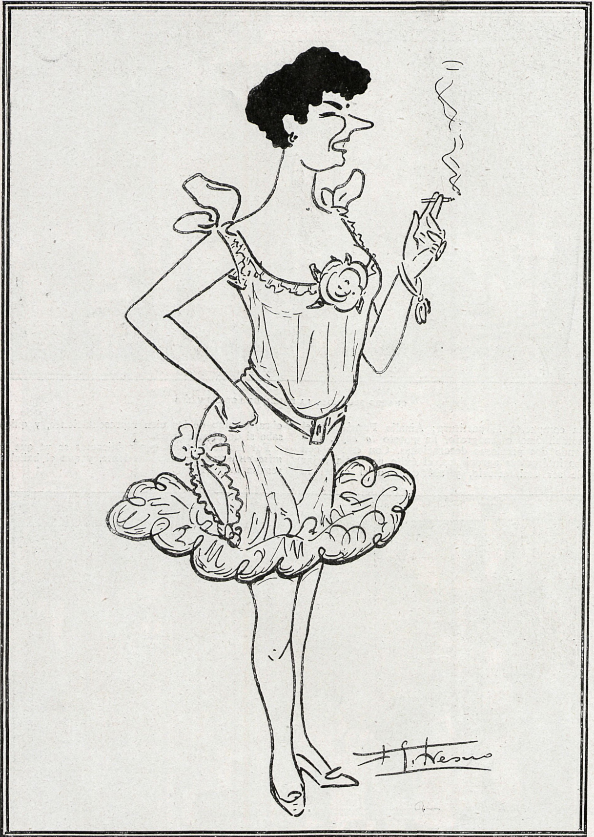
LA PRIMERA TIPLE DE ESLAVA JULITA FONS