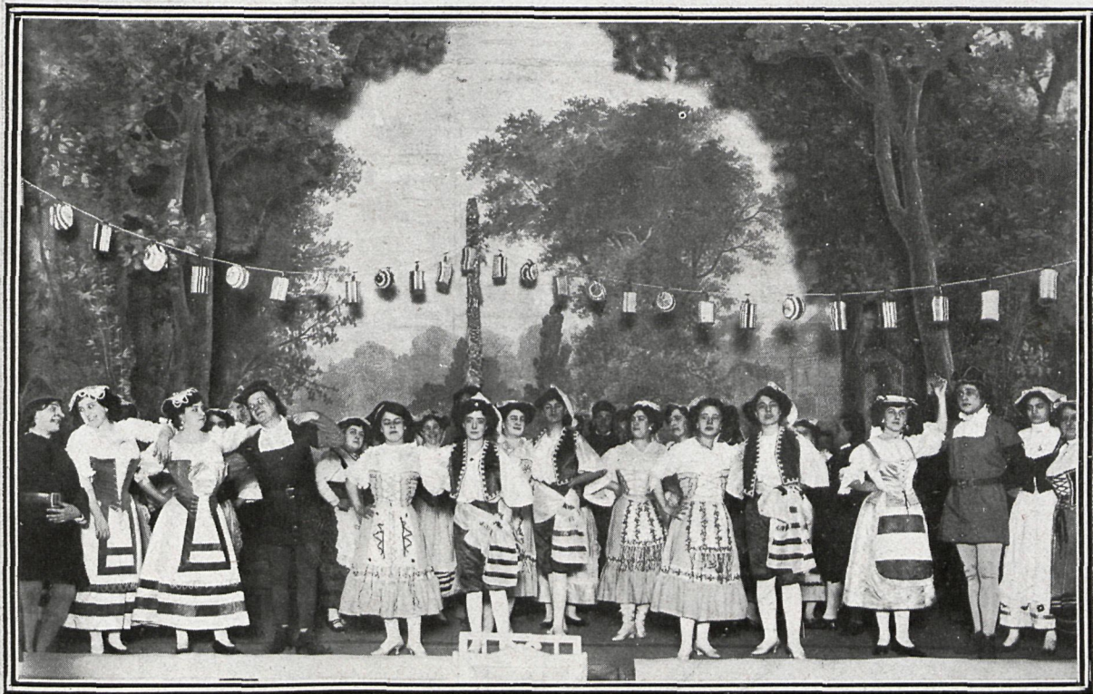
CUADRO SEGUNDO. LA DANZA DE LOS CLAVELES

ha compuesto la partitura; Amalio Fernández, el notabilísimo escenógrafo, ha puesto lo suyo , pintando dos preciosas decoraciones. Con esto y con los intérpretes apropiados, el éxito no podía dejar de ser satisfactorio, y ahí está en el cartel la