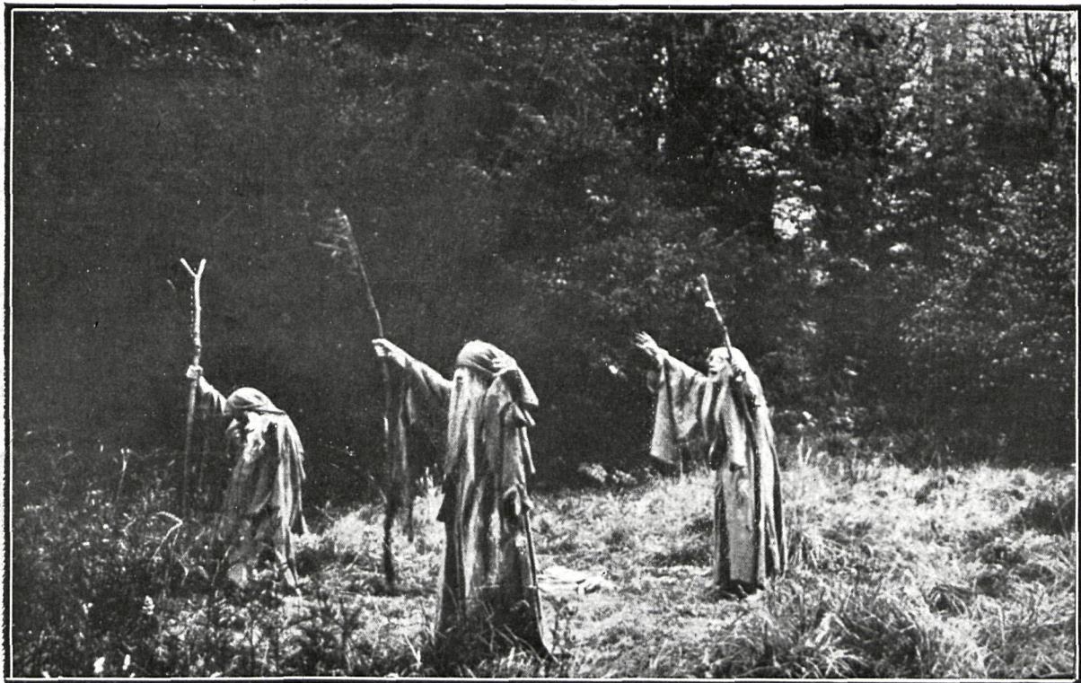
UNA REPRESENTACIÓN EXCEPCIONAL DE MACBETH, EN LA ABADÍA DE SAINT WANDRILLE. ACTO PRIMERO. ESCENA PRIMERA, LA APARICIÓN DE LAS BRUJAS

presentación única del Macbeth , de Shakespeare, traducido por Maeterlinck, é interpretado por la esposa de éste, Georgette Leblanc en la abadía de Saint Wandrille, lugar en donde se suponen ocurridas las principales escenas del drama, conservarán de esta audición recuerdo imborrable. Las ficciones de la escenografía fueron substituidas por la verdad de la realidad, y así fué de intensa la impresión que produjo la inmortal obra.