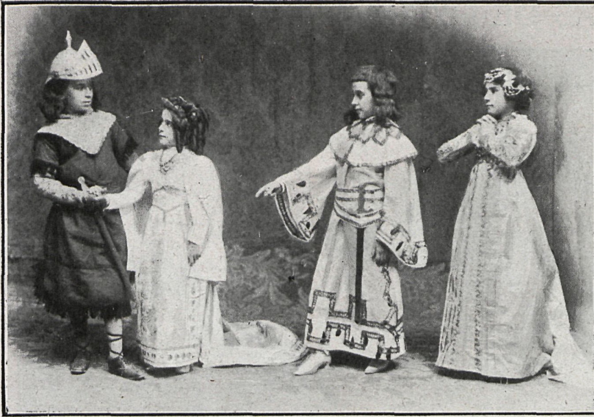
UNA ESCENA DE LA INFANTA DE LOS BUCLES DE ORO