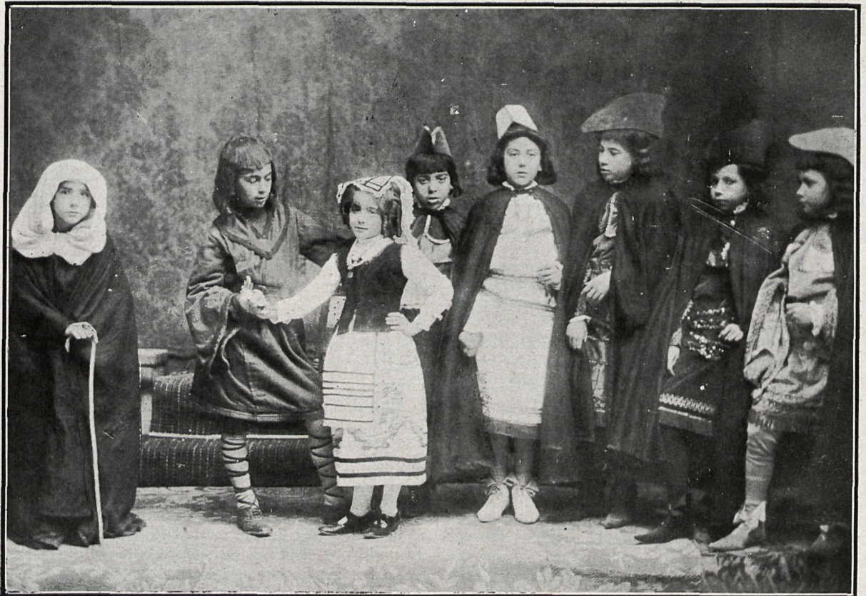
LA INFANTA DE LOS BUCLES DE ORO. OTRA ESCENA DE LA OBRA