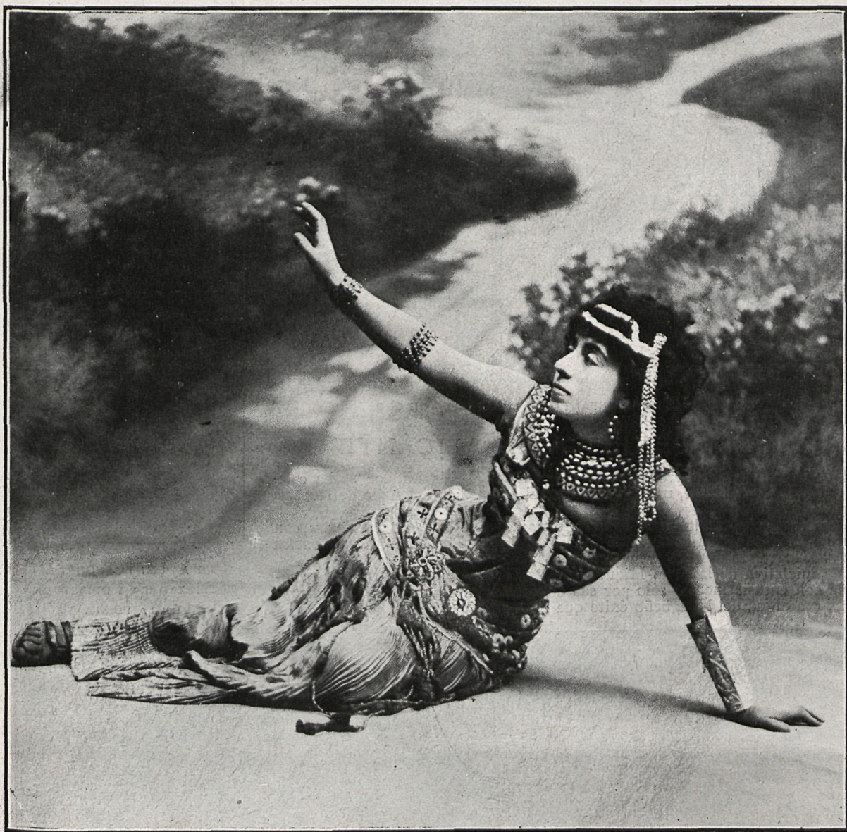
MATILDE DE LERMA EN AIDA